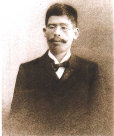
藤野先生照片和照片背后题词