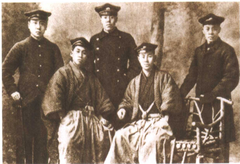
日本仙台医专同学送别鲁迅(左起第一人)