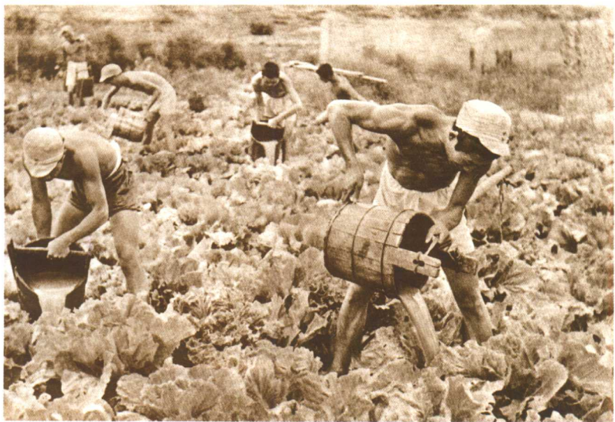
延安八路军战士浇灌菜地