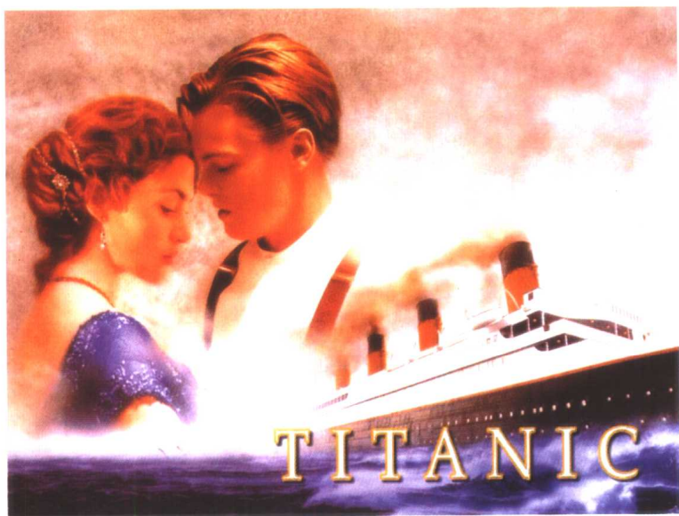
电影《泰坦尼克号》剧照