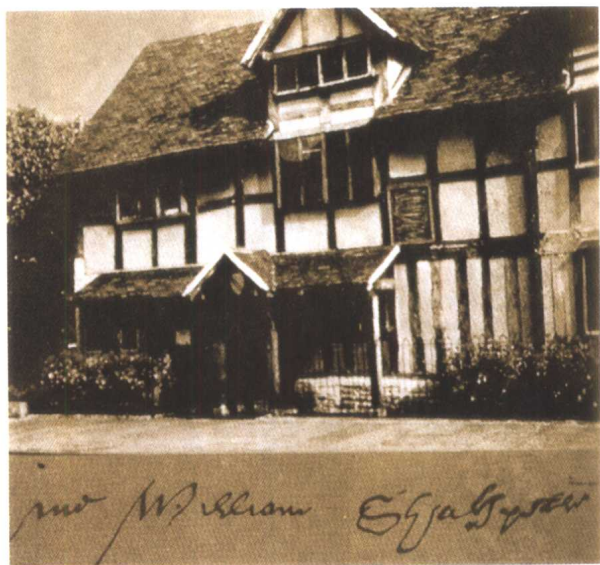
莎士比亚故居和他的签名