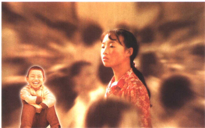
电影《一个都不能少》剧照