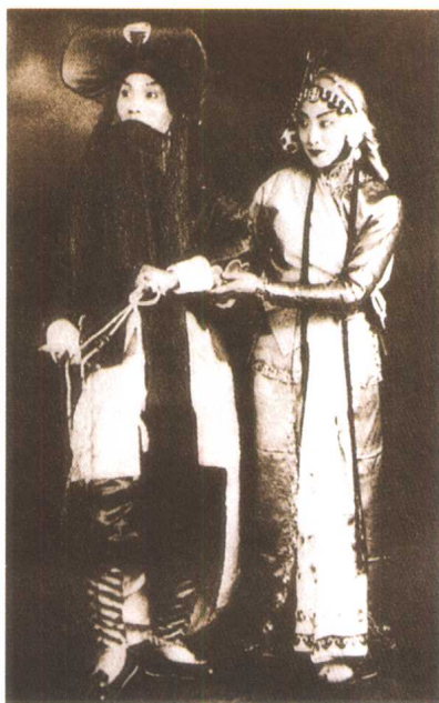
京剧《打渔杀家》剧照