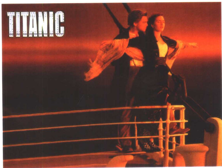
电影《泰坦尼克号》剧照