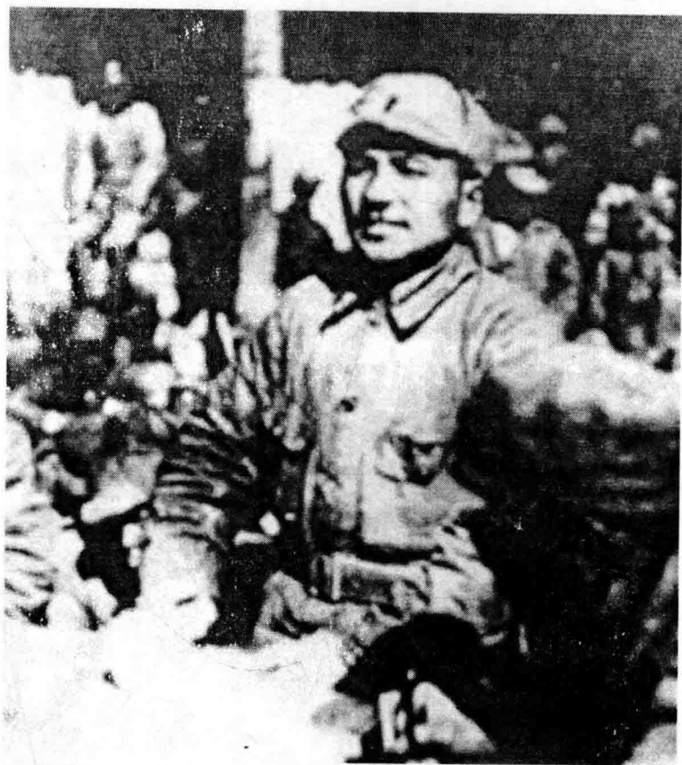
1938年春邓小平在黎城