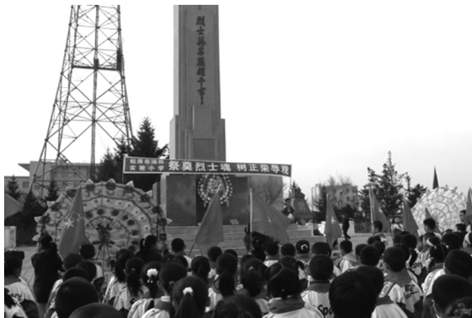
清明节人们向烈士献花

清明节已有 2500 多年历史，发生在草木吐绿、万物苏醒之时，又美其名曰踏青节。按阳历来说，它是在每年的 4 月 4 日至 6 日之间，它是唯一的既是节气又是节日的传统节日。