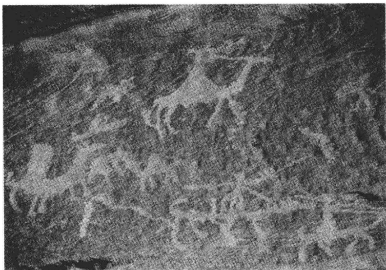
公元前 2000 年刻在西奈山石头上的铭文