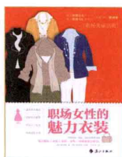
职场女性的魅力 衣装