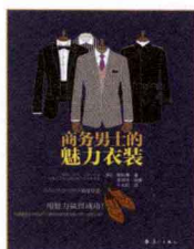
商务男士的魅力 衣装