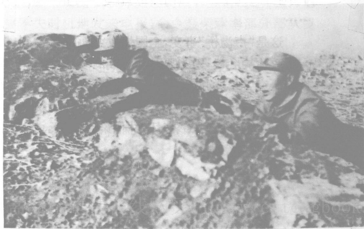
晋察冀一分区司令员杨成武(右)在前线指挥战斗。