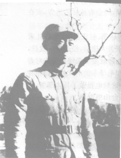
晋察冀军区司令员聂荣臻。