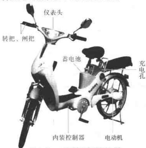
图 1-2 多功能型电动自行车

2. 多功能型 见图 1-2, 这种电动自行车是在标准型电动自行车基础上增加前照灯、电喇叭、前叉减振器和坐垫减振器等, 其特点是功能较多, 骑行较舒适。