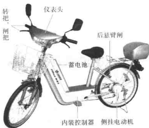
图 1-1 标准型电动自行车

2. 多功能型 见图 1-2, 这种电动自行车是在标准型电动自行车基础上增加前照灯、电喇叭、前叉减振器和坐垫减振器等, 其特点是功能较多, 骑行较舒适。