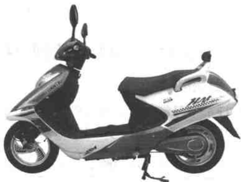
图 1-3 豪华型电动自行车

3. 豪华型 也称电动摩托车, 见图 1-3。这种电动自行车的特点是造型新颖, 一般采用摩托车车头。这类车通常在把手上增设仪表盘, 以显示速度、里程、电压、电量等。