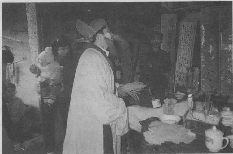
◎四川省江北縣舒家鄉漢族祭財神之引兵土地。

慶壇祭祀，分內壇正法事與外壇戲劇表演。下壇法事依次共二十四壇，內容均有詳細介紹。文後並附有端公演唱戲劇本、唱本、實地所攝照片、手訣圖片等珍貴資料。