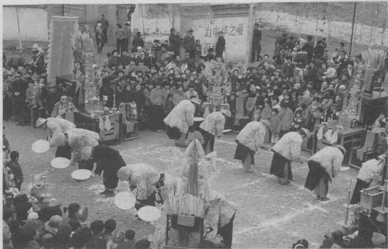
◎扇鼓神譜中十二神家參拜東西壇。

《扇鼓神譜》是山西省曲沃縣下裴莊鄉任莊村許氏家族記錄古代儺祭和祀神活動的抄本，是近年來中國戲曲史料重要發現之一。任莊許姓扇鼓儺祭活動，歷史久遠，其主幹部分禳瘟逐疫源於漢唐，在千百年流變過程中，逐漸融合了道教的陰陽八卦、五方五行觀念以及神祇祭祀儀式和民間慶賞習俗，吸收了唐宋以後各時期眾多的民間娛樂形式和技藝表演，成爲一種多層次、多方面內容的複雜結合物。本報告收入《扇鼓神譜》的全部內容和有關資料，詳實記錄了扇鼓儺祭和獻藝活動的組織、程序、所用服飾、道具、樂奏、祭器和淵源流變，爲中國儺文化和儺戲研究提供了極其寶貴的資料。