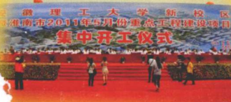
● “春华秋实”——校友纪念