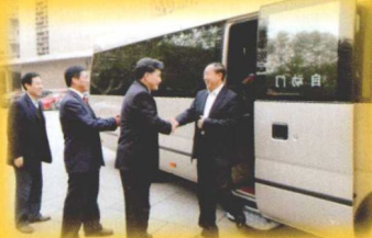
● 安徽省领导来校视察