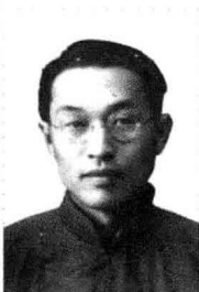
次子梁思永 (1904 - 1954) 著名考古学家