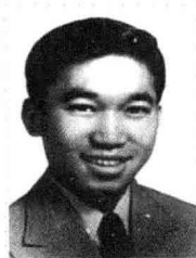
五子梁思礼 (1924 - ) 火箭控制系统专家

梁启超的子女们各有自己的成就，皆成为本行业的专家。他们做人低调，却又默默无闻奉献。他们都不倚靠父亲梁启超的名声，而像陶行知先生所说“滴自己的汗，吃自己的饭”；他们又都和他们的父亲一样，有一颗热忱的爱国心。梁启超有3个儿子是院士。其中，梁思成、梁思永兄弟1948年同时获选为第一届中央研究院院士；梁思礼则于1993年当选为中国科学院院士。梁氏一家真可谓“满门俊秀”。