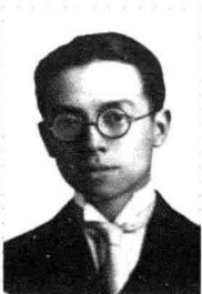
长子梁思成 (1901 - 1972) 著名建筑学家