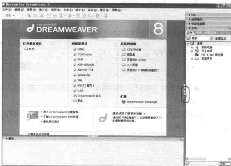
▲ 若要将右方面板隐藏可单击鼠标所在的位置