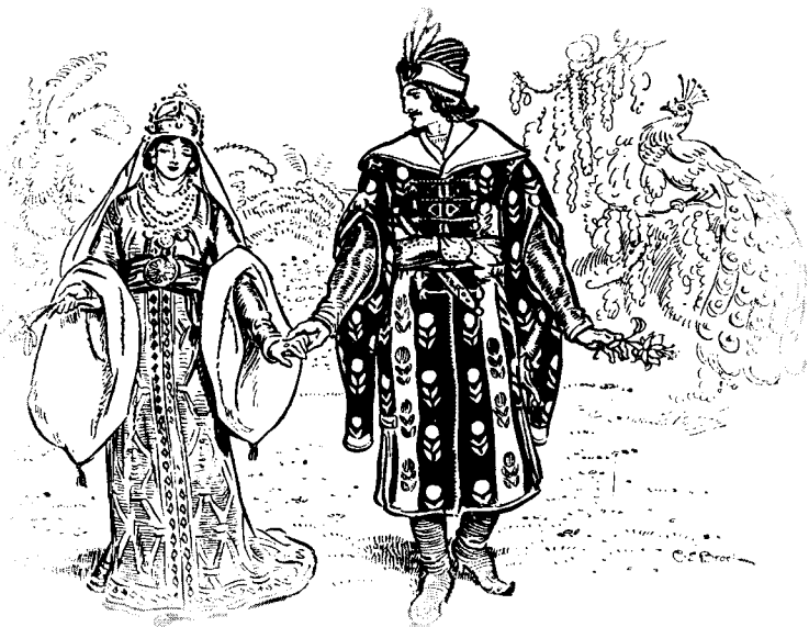
小王子穆尔加插图 From "SUCNA MURGA"

THE Rumanian Fairy Tales which appear now for the first time in an English translation form only a small portion of the vast treasure of tales and legends known and told in Rumania. Those included