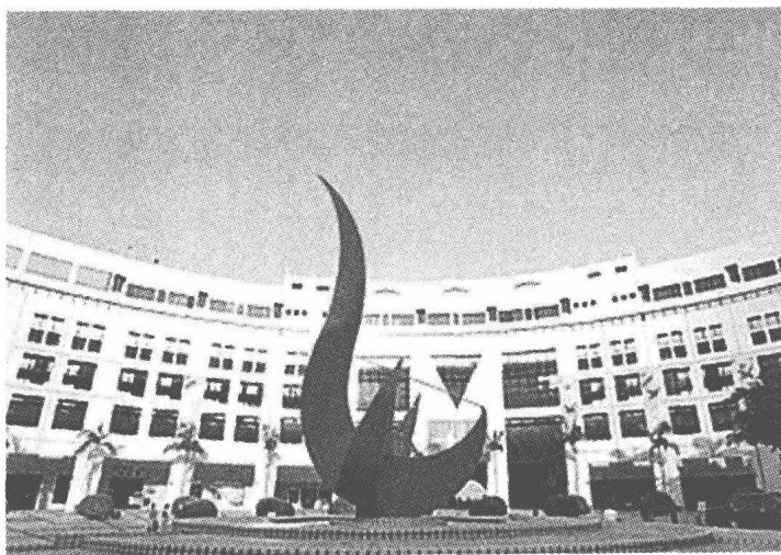
图 1-4 香港科技大学

据香港《文汇报》2007年11月13日报道，葛炜炜网志中以“永无忧愁”(neverworried)的网名断断续续记录了自南京大学硕士毕业后来科大深造的心路历程。他写道：