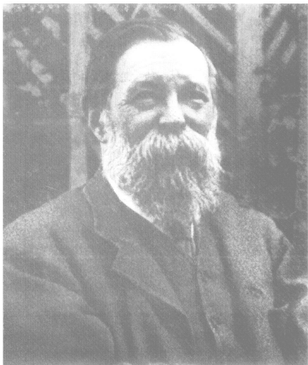
恩格斯逝世前的最后一张照片（二八九三年）