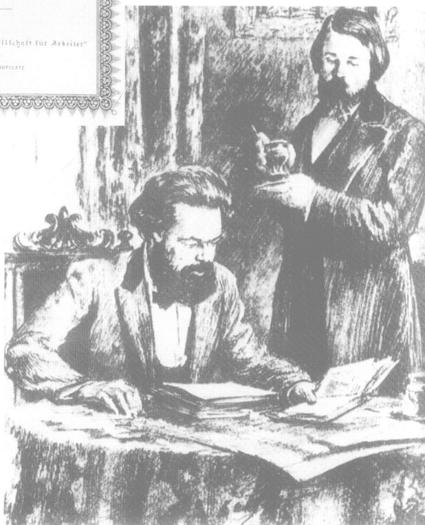
马克思与恩格斯在工作中