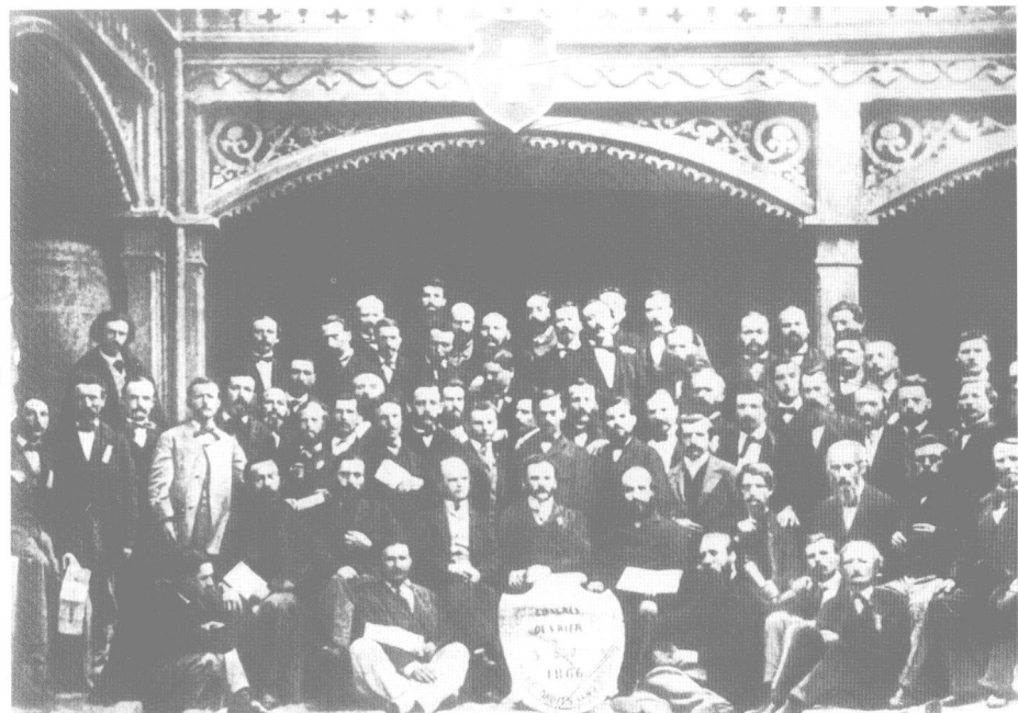
国际日内瓦代表大会代表