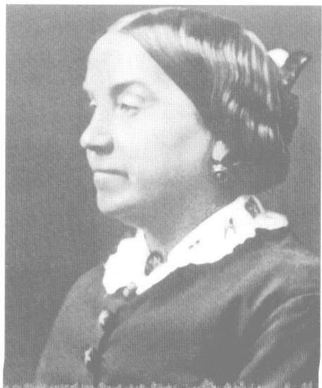
莉迪娅(莉希)·白恩士(1870年)