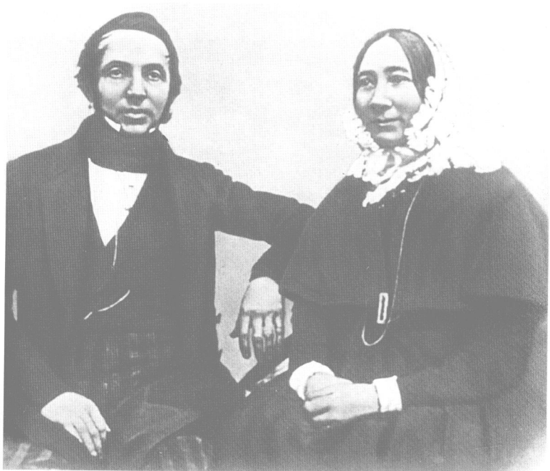
白(爱丽莎)·弗兰契斯卡·恩格斯 恩格斯的父亲老弗里德里希·恩格斯， 母亲伊丽莎