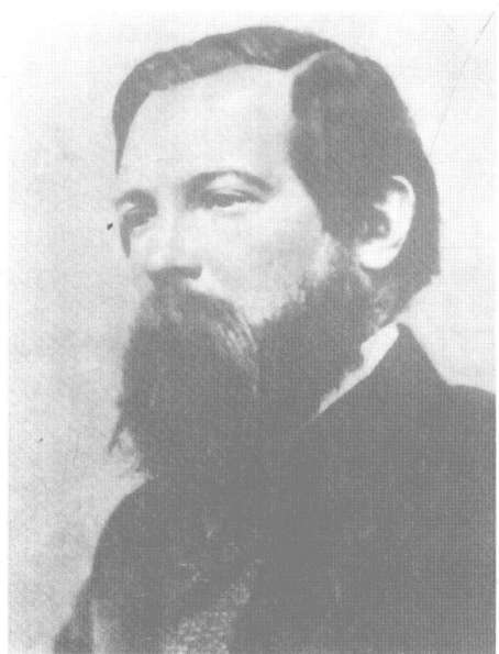
五十年代的恩格斯