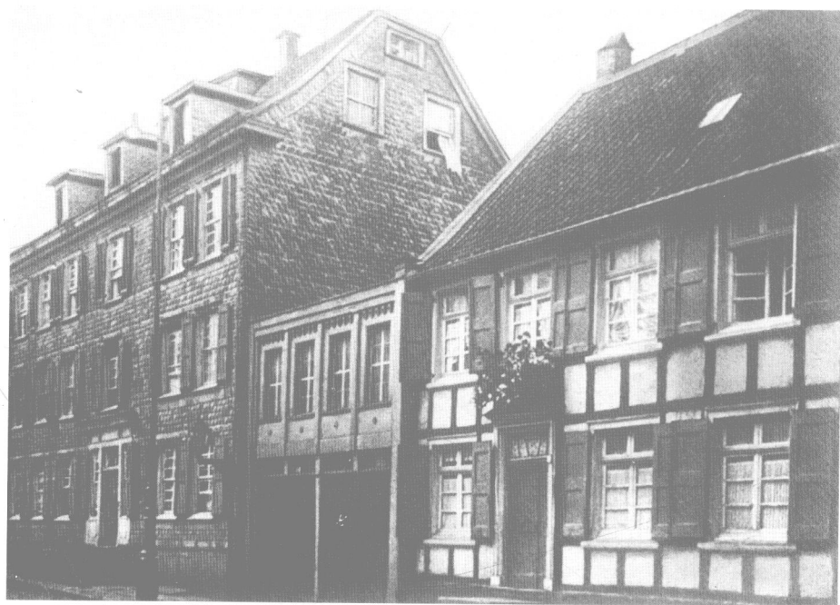
恩格斯诞生在巴门的这所房子里