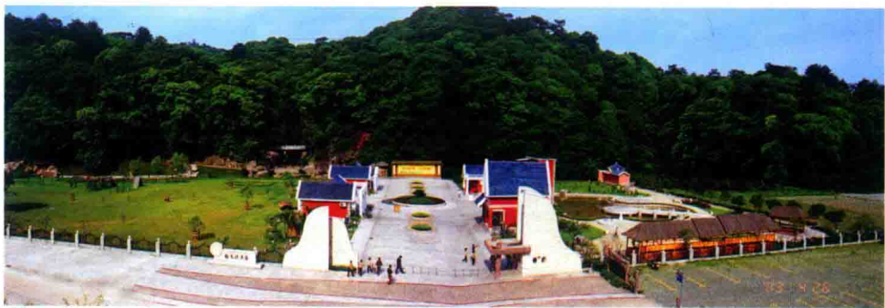
格氏栲国家森林公园