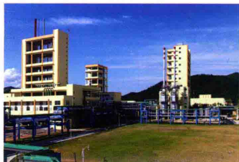
三农万吨有机氟生产项目