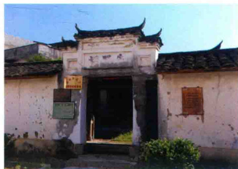
忠山村党支部、农会、苏维埃政府旧址