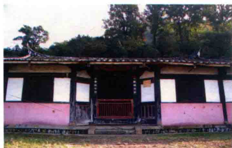
西际村工农红军西际物资采购站旧址