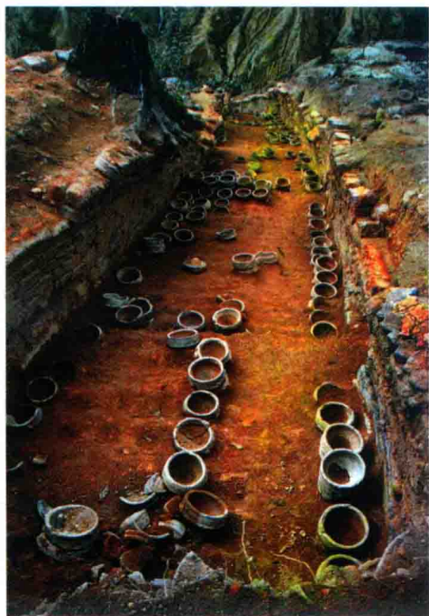
中村回瑶千年古窑遗址