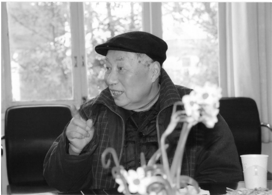
2008 年 85 岁的康老畅谈从教心得

其一，开好见面会。在和全班同学初次见面的会上做必要的自我介绍，讲明学校组织“忘年交结对活动”的意义、自己对开展活动的设想，并听取同学们的意见和要求。其中，我参加首届“忘年交结对活动”与结对班同学在课堂初次见面的情景给我留下了深刻的印象。在告别讲坛多年之后，又有缘和青年同学欢聚一堂，我仿佛有重返讲台之感。会上师生袒露胸怀，赤诚相见，虽则先生后生，悬隔一轮花甲（我于 1923 年出生，同学们则大多出生于 1983 年），而讲学辅仁，不乏共同语言（曾子曰：“君子以文会友，以友辅仁。”朱注释之曰：“讲学以会友，则道益明；取善以辅仁，则德日进。”我约取其文义）。会后欣然命笔感赋七律一首以志不忘“忘年相友却同庚，花甲相悬恰一轮。嘉会融融初见面，赤诚款款互交心。老师倾吐育人愿，弟子纷陈敬老情。讲学辅仁来日永，何分毫耄与年轻。”