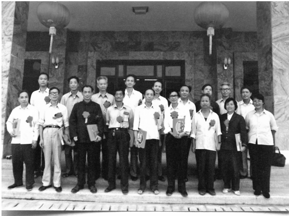
1984年校先进工作者合影（前排左1为作者）

1984年入党后，我更是坚持埋头苦干，作一颗小小而坚硬的铺路石，铺向那实现社会主义现代化的万里征途上。于是我在1985年的七律《首届教师节感怀》里写下了“此身容作砭砭石，铺向康庄万里程”的尾联。我于1988年退休，1989年暂离讲席，可还是念念不忘那三尺讲台。因此，在1989年的一首自寿的七律里，我情不自禁地吐露了“梦魂犹系讲坛上”的