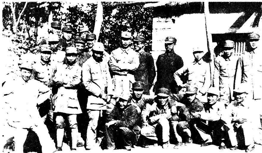
1940, 10. 桃峪会议人员合影