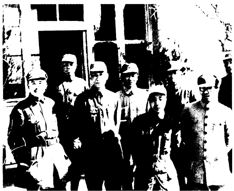
16 1942年春，罗荣桓等山东领导人与刘少奇合影