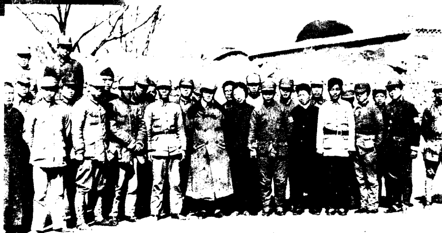
14 1939年春，罗荣桓、陈光等在鲁西东平参加赵缚婚礼时合影