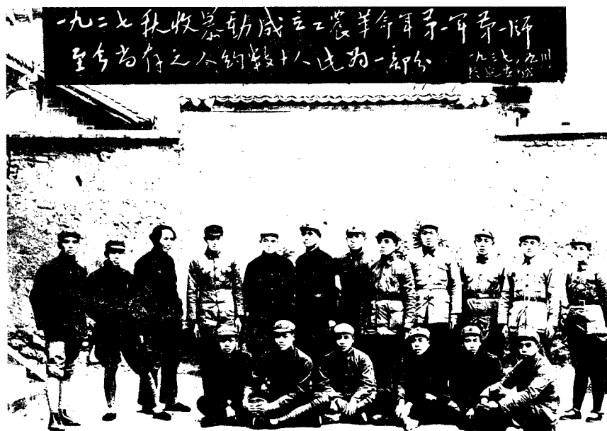
3 1927年秋收暴动后成立的工农革命军第一军第一师的部分同志，十年后在延安合影