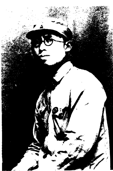
9 1937年8月，罗荣桓任 一一五师政治部主任