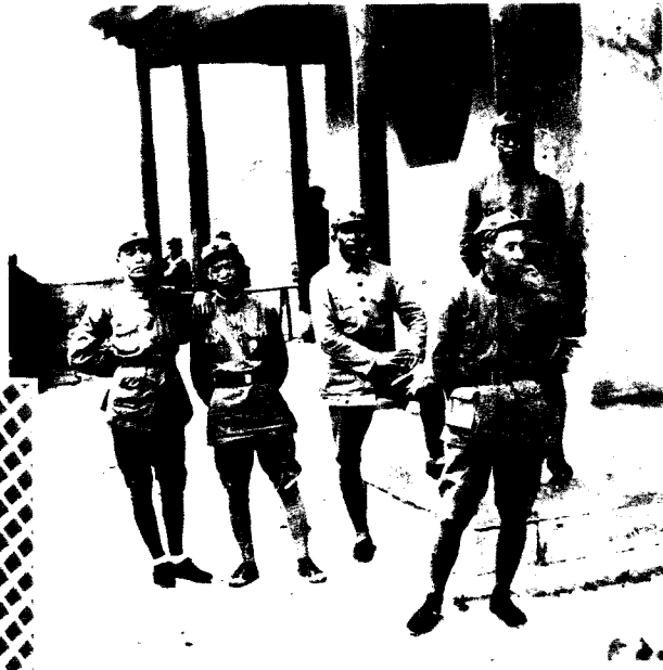
5 1937年春，罗荣桓和林彪、杜理卿、冯文彬、谭政等在延安城楼上合影