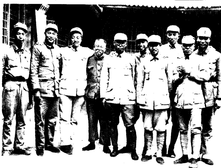
12 中共六届六中全会期间，罗荣桓和徐海东、贺龙、谢觉哉、肖克、关向应、罗瑞卿、杨尚昆、肖劲光等合影