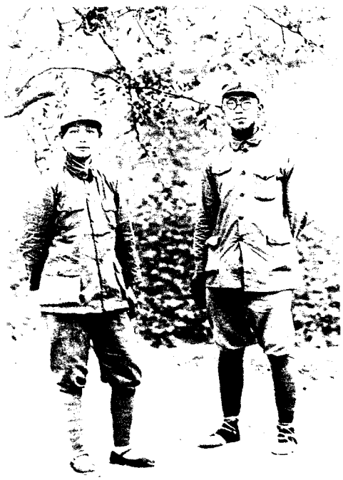
11 罗荣桓与林月琴在 山西孝义合影