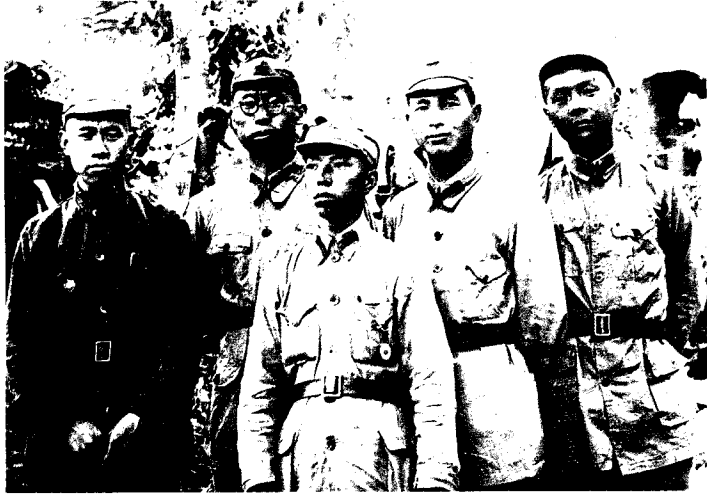
4 1935年10月，罗荣桓（左二）和第一军团政治部部分同志合影