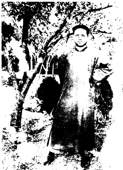
2 1925年罗荣桓在青岛大学读书时，在樱花树前留影