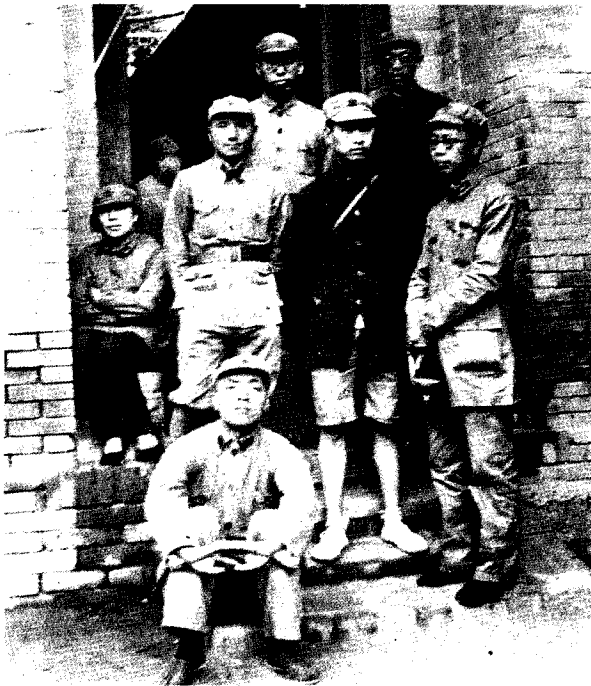
8 1937年，罗荣桓和邓小平、杨尚昆、陆定一、黄克诚、杨奇清、李伯钊等在陕西三原县云阳镇合影