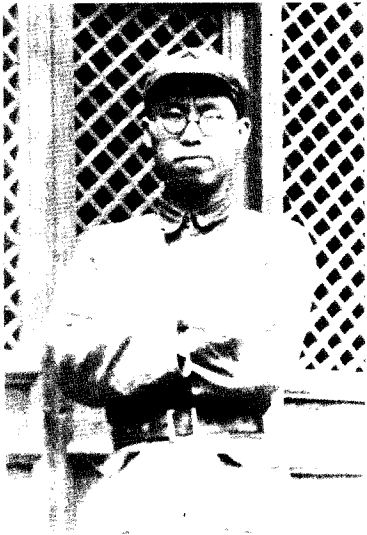
6 1937年，任后方政治部主任的罗荣桓