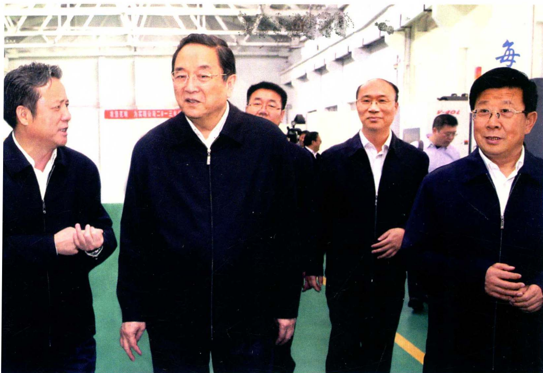
2013年3月24日，中共中央政治局常委、全国政协主席俞正声视察〇六一基地