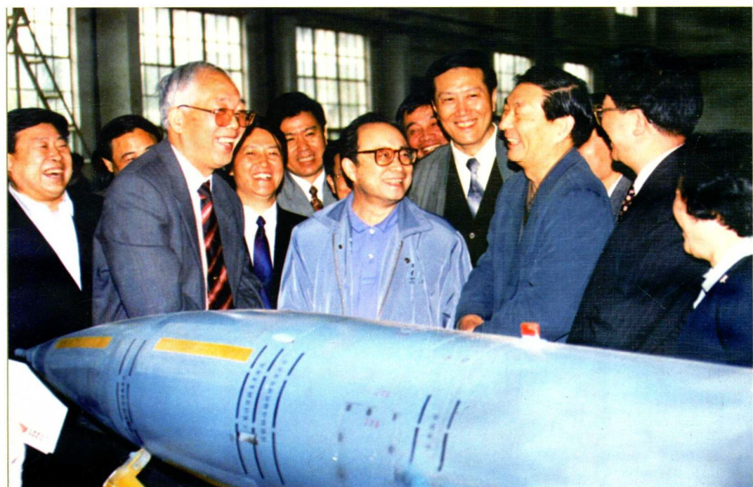
1996年4月26日，中共中央政治局常委、国务院总理朱镕基（前排右三）视察五三一厂工作