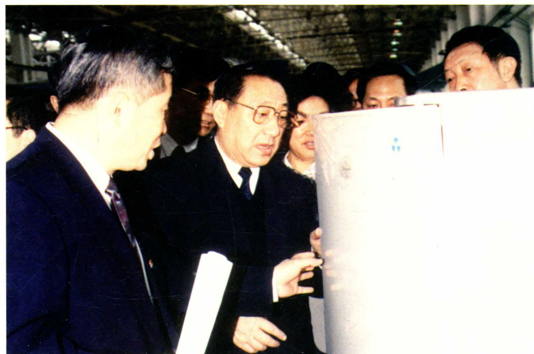
1995年4月19日，中共中央政治局常委、国务院副总理（时任中共中央政治局委员、国务院副总理）李岚清（图中）视察风华电冰箱厂