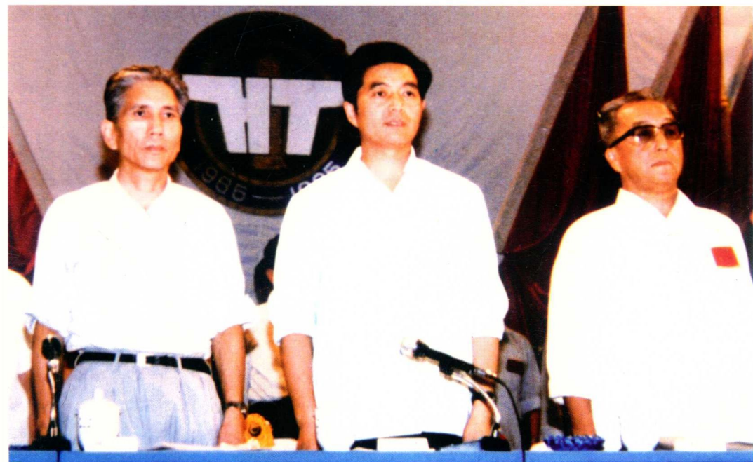
1985年9月5日，中共中央总书记（时任贵州省委书记）胡锦涛（图中）出席〇六一基地成立20周年大会