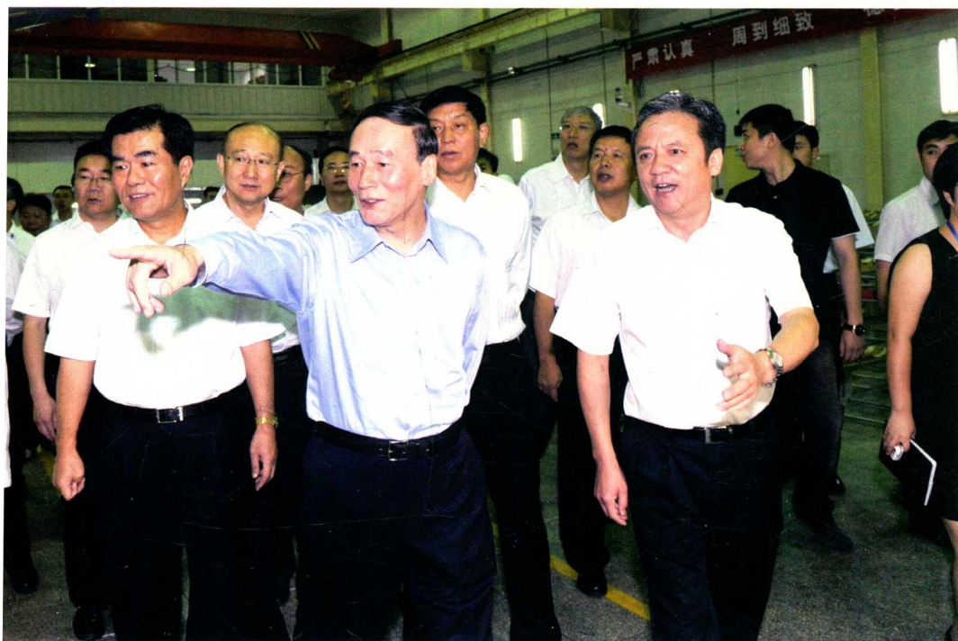
2011年8月18日，中央政治局常委、中央纪委书记（时任中央政治局委员、国务院副总理）王岐山（图中）视察五三一厂