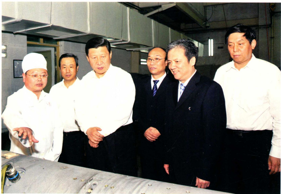
2011年5月9日，中共中央总书记、国家主席、中央军委主席（时任中共中央政治局常委、国家副主席）习近平（左三）视察中国航天科工集团10院