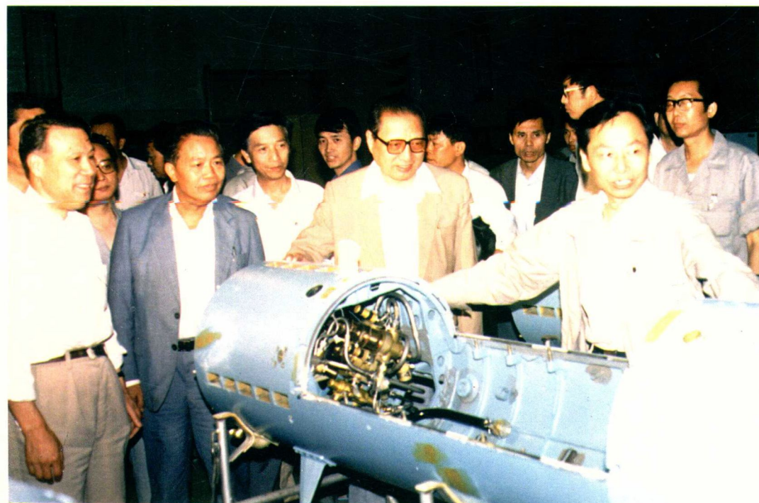
1990年6月25日，中共中央政治局常委、全国人大常委会委员长乔石（图中）视察五三一厂