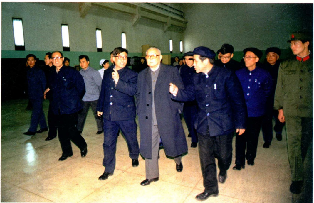
1985年3月17日，中共中央政治局常委、国家主席李先念（前排中）视察五三一厂