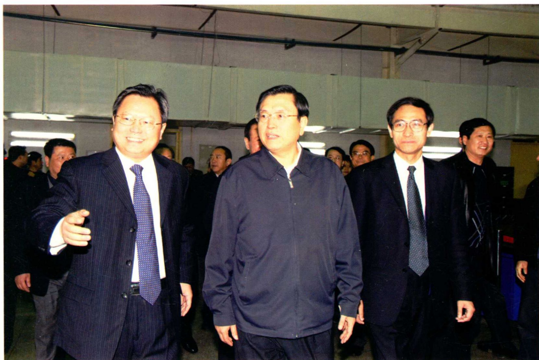
中共中央政治局常委、全国人大常委会委员长张德江（前排中）视察〇六一基地