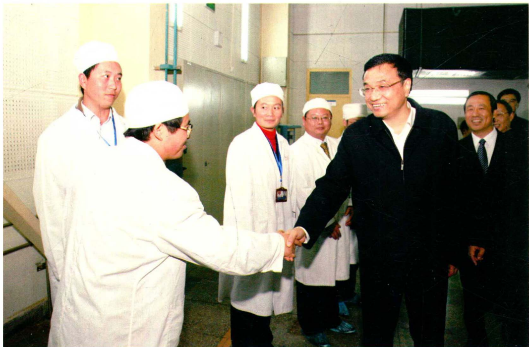
2009年10月18日，国务院总理（时任中共中央政治局常委）李克强（右一）视察 〇六一基地军工企业