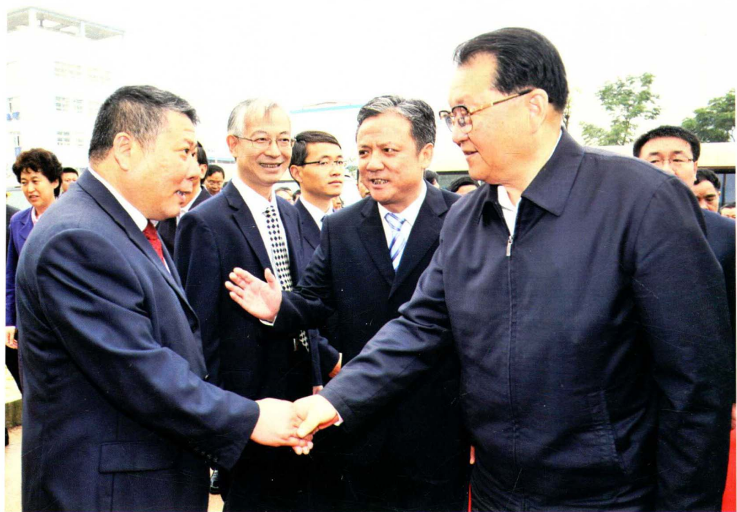
2012年10月14日，中共中央政治局常委李长春（右一）视察遵义航天城