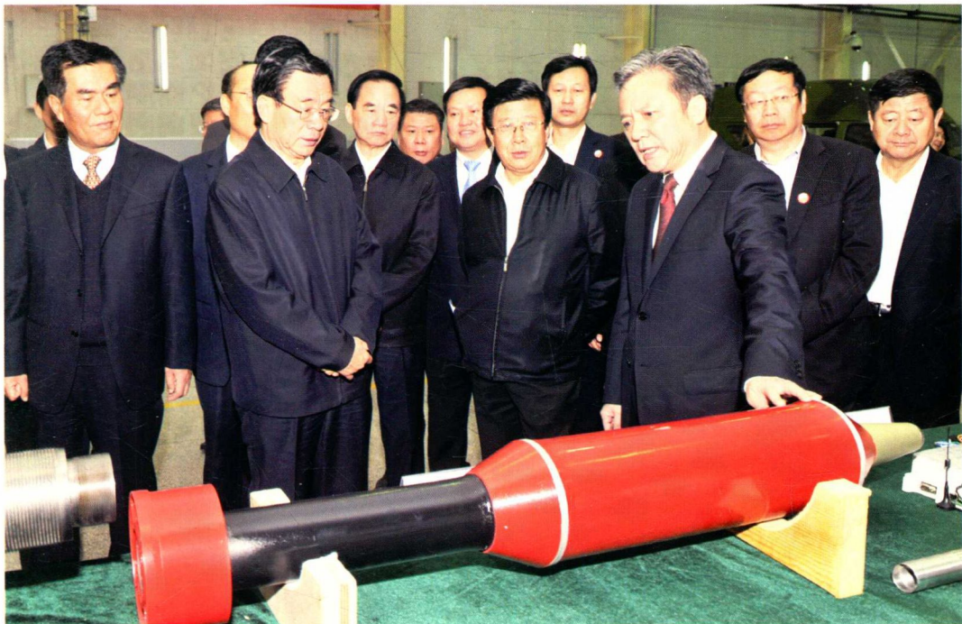
2011年10月31日，中共中央政治局常委、中央纪委书记贺国强（前排左二）视察航天风华精密设备公司