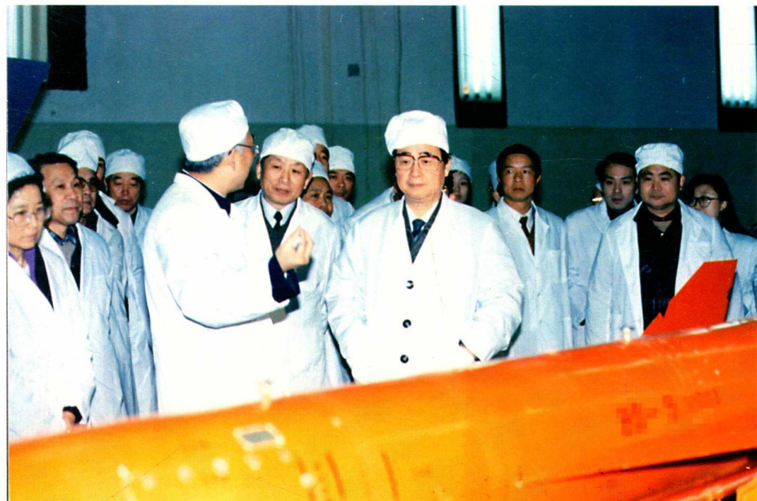
1991年2月9日，中共中央政治局常委、国务院总理李鹏（前排右二）视察〇六一基地