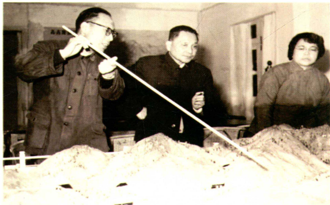
1965年，中共中央总书记、国务院副总理邓小平（图中）听取“三线建设”规划情况汇报

老一代无产阶级革命家毛泽东（右一）、周恩来（中）、邓小平（左一）等十分关心国防工业建设。毛主席曾动情地说：“三线建设不起来，我是睡不好觉的。”他更严肃地指出：“三线建设，现在不为，后悔莫及。”