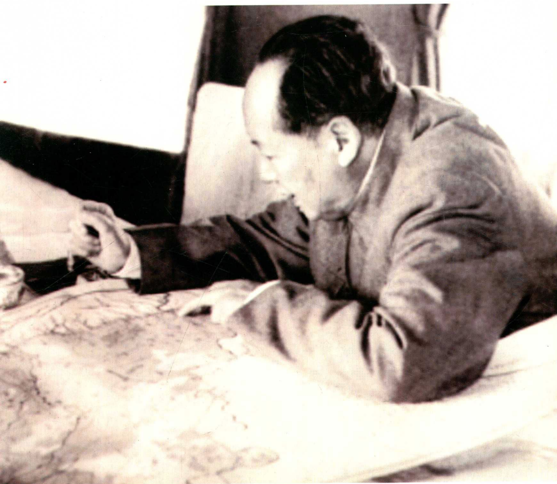
中共中央主席、中央军委主席毛泽东圈定“三线建设”范围