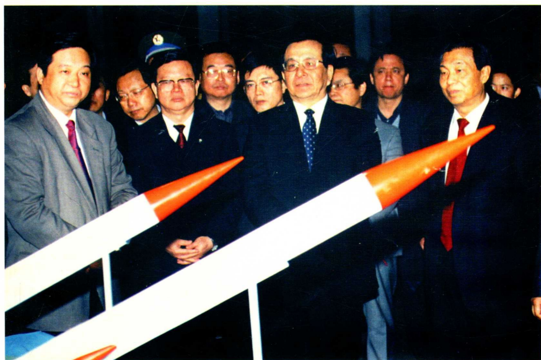
2003年4月11日，中共中央政治局常委、国家副主席曾庆红（图中）视察五三一厂