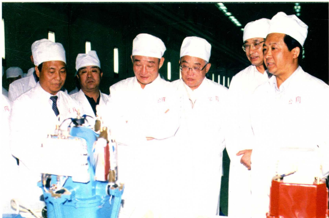
2000年7月4日，中共中央政治局常委、全国人大常委会委员长（时任国务院副总理）吴邦国（右四）视察〇六一基地