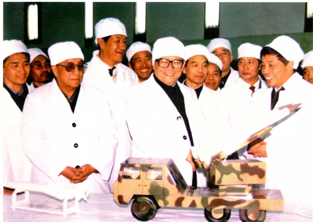
1991年12月20日，中共中央总书记江泽民（图中）视察五三一厂