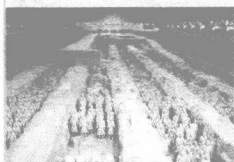
shǎn xī xī ān bīng mǎ yǒng 陕西西安兵马俑