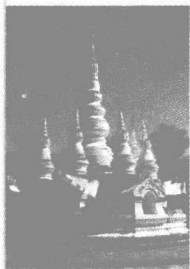
yún nán xī shuāng bǎn nà 云南西双版纳