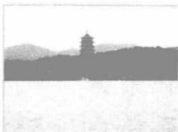
zhè jiāng háng zhōu xī hú 浙江杭州西湖