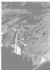
gān sù dūn huáng mò gāo kū 甘肃敦煌莫高窟