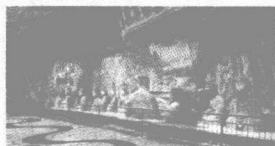
chóng qing dà zú shí kè 重庆大足石刻