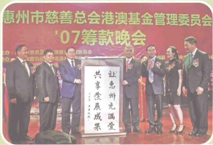
◁ 中共惠州市委书记、市人大常委会主任黄业斌（左三）题词