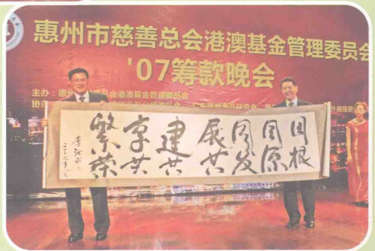
中共惠州市委副书记、市长李汝求▷ （左一）题词