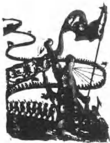
林夫木刻《中国一日》