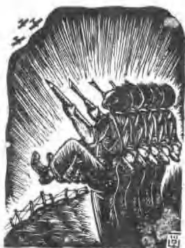
刊于一九四〇年六月《画陈》第一期 作者 苏味翔