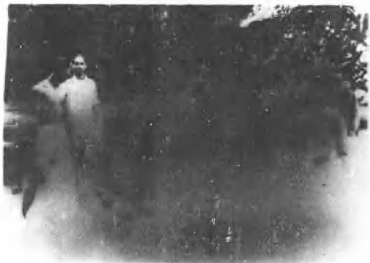
抗日救亡宣传队下乡演出活动情况