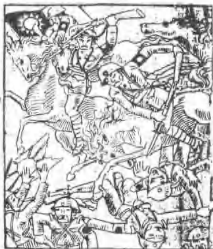
漫画《与敌人清算一下血债！》 君爽作 作于一九三七年十一月