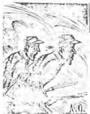
林夫木刻《中国一日》