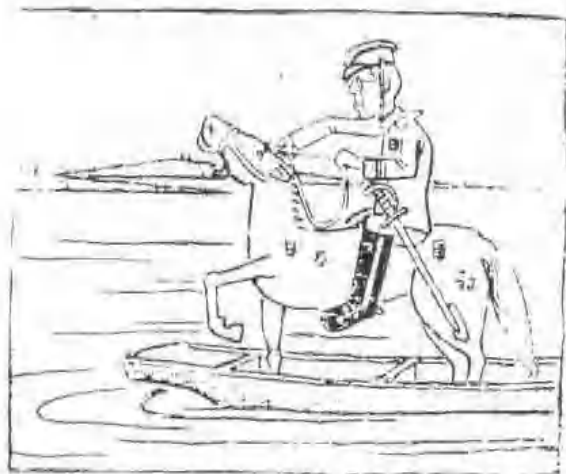
漫画《船头上跑马——走投无路》 君爽作 作于一九三八年三月