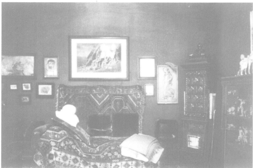
弗洛伊德从1890年开始使用的著名的精神分析躺椅。