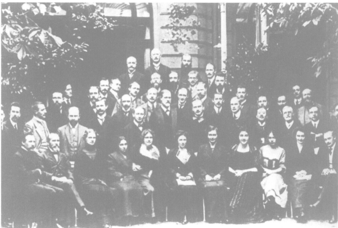
1911年9月,第三届国际精神分析学大会在德国魏玛召开。中为弗洛伊德,其右下方为费伦茨,左边为荣格。