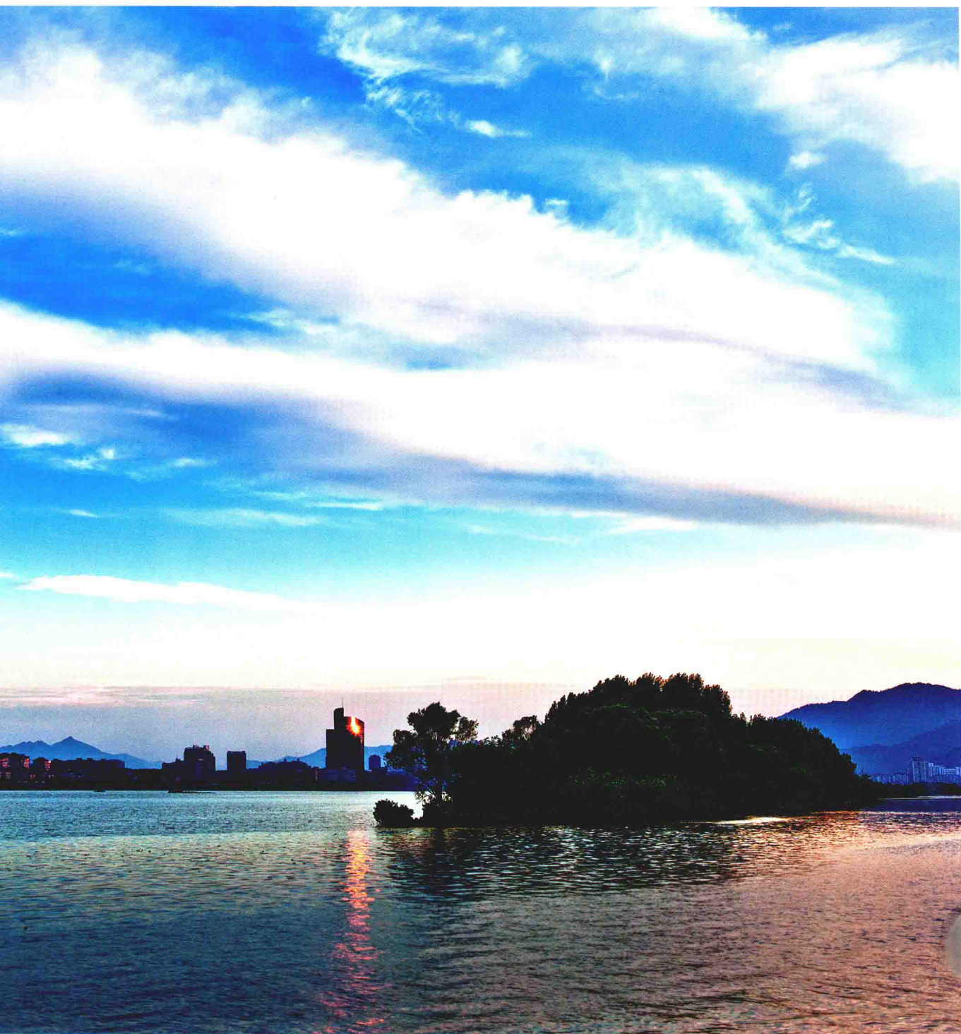
2012年7月摄于春江杨浦沙