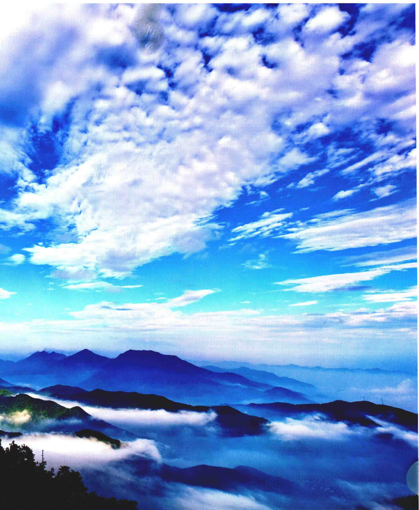
2009年6月摄于里山镇安顶山