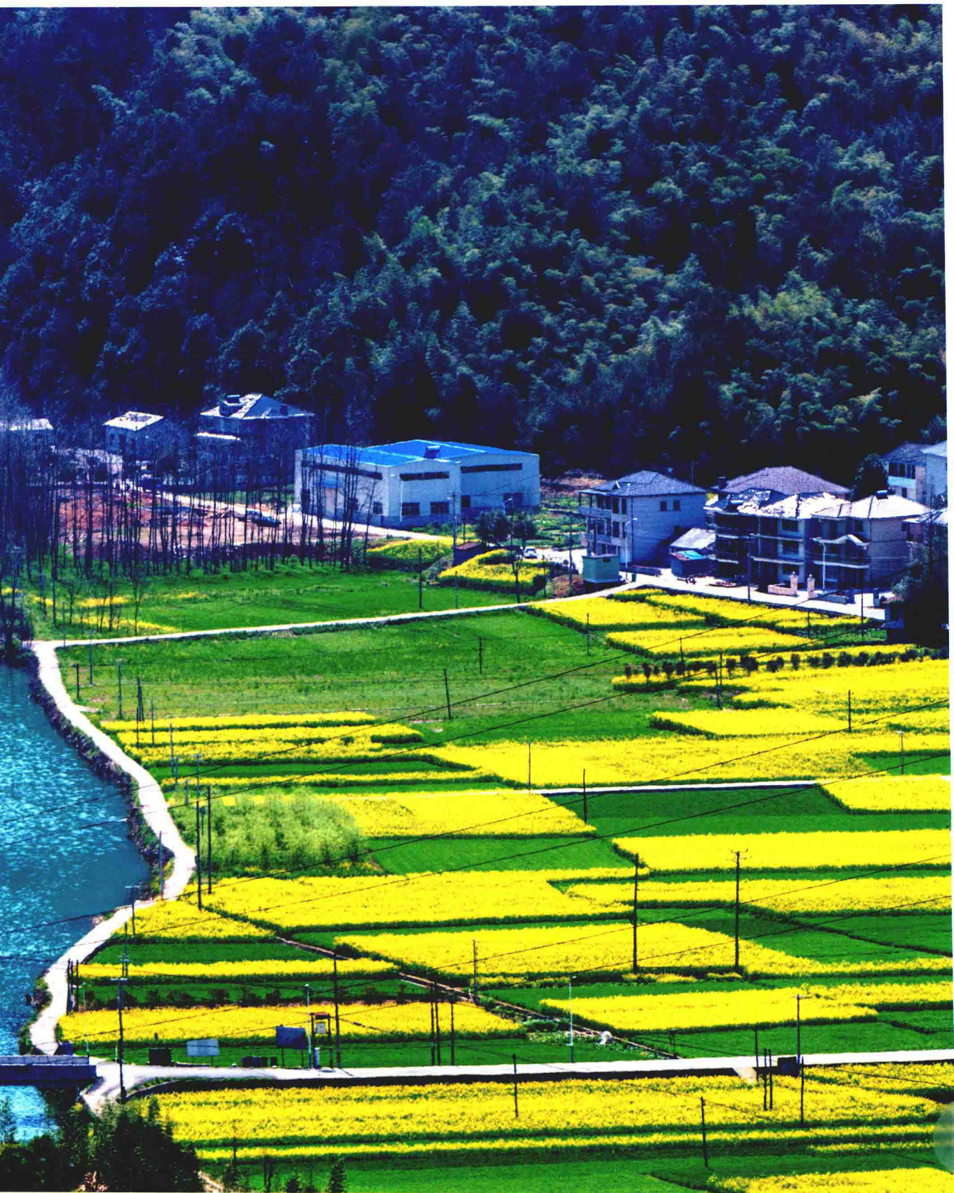
2015年3月摄于洞桥镇洞桥村横洞山