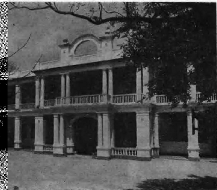
第三至五届广州农民运动讲习所旧址(东皋大道一号)