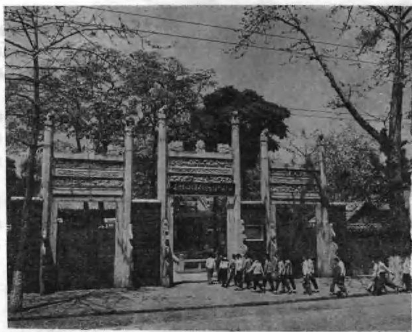
第六届广州农民运动讲习所旧址 (原惠爱东路番禺学官, 现中山四路四十二号)