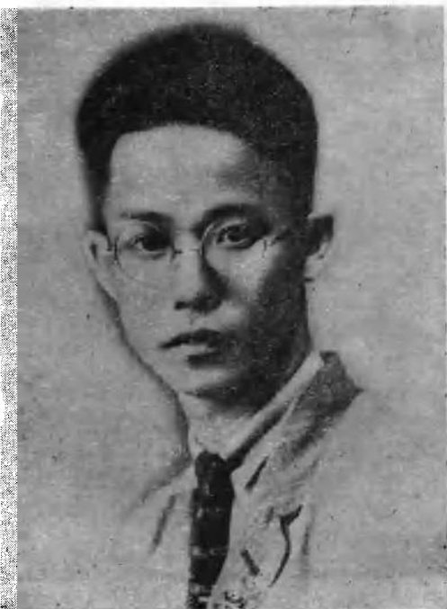
左上：广州农民运动讲习所第一至六届教员，第一、五届主任彭湃同志