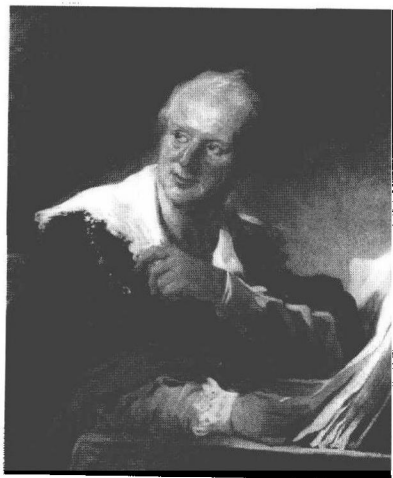
图 1.2 狄德罗

艺术批评作为创作与欣赏之间重要的中间环节，对创作和欣赏进行沟通，反映了欣赏者的审美需求，有助于艺术家提高创作的水平。而艺术家创作的直接和最终目的为广大的艺术欣赏者提供欣赏对象，满足欣赏者的欣赏要求。没有不需要艺术批评的艺术家，正如狄德罗(图 1.2)认为，即使是非常有才华的艺术家也总是需要批评的，如果他能遇到一个名副其实并且才华横溢的批评家，那么他算是非常幸运的。