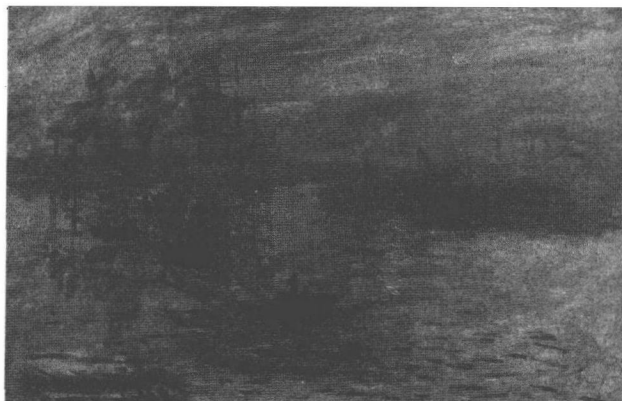
图 1.6 印象·日出 莫奈

这个词语至今风靡全世界，起先只是被画家们自己所接受，后来，不同领域的人们都接受了。不同的人对印象主义的定义有所不同，因而在技术、美学、哲学上其意义广狭不一，它的定义不是唯一的。印象主义画家先后举办了 8 次展览，前两次均受到当时舆论界的猛烈抨击，以后逐渐成为具有很大影响力的美术流派，并扩大到其他艺术领域。随着当时科学技术的不断提高，有关光学方面的研究表明物体所固有的特性不是颜色，而是物体反射出来的光线。1886 年以后，印象派团体宣布解散，虽然其存在时间很短，但在艺术史上却完成了一次史无前例的巨大革命，使西方艺术从既定束缚关系中解放出来，无论是后