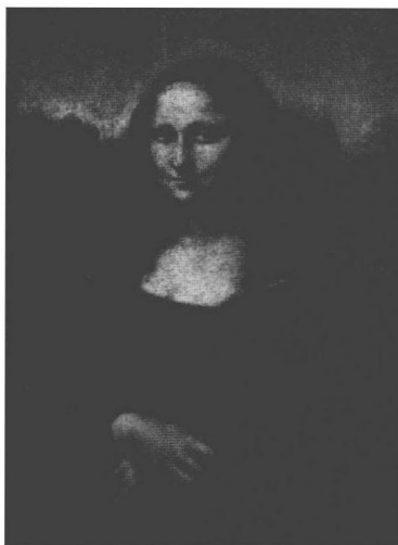
图 1.5 蒙娜丽莎 达·芬奇