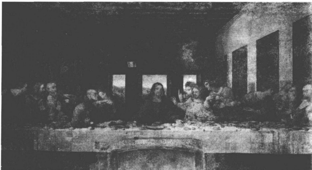
图 1.4 最后的晚餐 达·芬奇

办了展览。在展览中，莫奈的油画“印象·日出”(图 1.6)的标题被一位保守的记者路易·勒鲁瓦在文章中借用以嘲讽这一类的艺术作品，“印象主义”由此而得名。