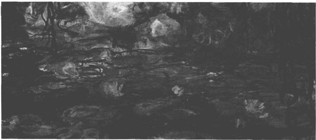
图 1.7 “睡莲”组画之夜间效果 莫奈

来产生的绘画还是文学艺术都得以从画家和题材之间解放出来。评论家们把画家自发形成的印象派及其理论进行总结，使之从生动的理想上升为一套绘画理论体系。在丰盈而睿智的艺术批评的阐释下，前面蜂拥而至的反对印象派的各种表现都逐渐销声匿迹了，印象主义逐渐受到绝大多数观众的接受和赞赏。莫奈作为印象派的典型代表，他对于艺术的追求在他晚年创作的《睡莲》(图 1.7)组画中表现得尤为突出，这些组画是在他年迈体弱、视力衰退的情况下完成的，作品具有恢弘的气势并散发出迷人的艺术表现力，而且富含东方意味的写意性，除了有印象主义所特有的率直之外，还有与自然相关联的神秘色彩。他忽略了瞬间的印象，设法追求绘画色彩关系的美，物象轮廓的写实主要用光线和色彩来表现。