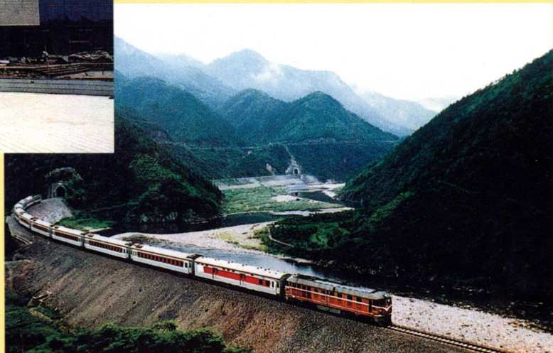
火车穿过隧道，奔向温州