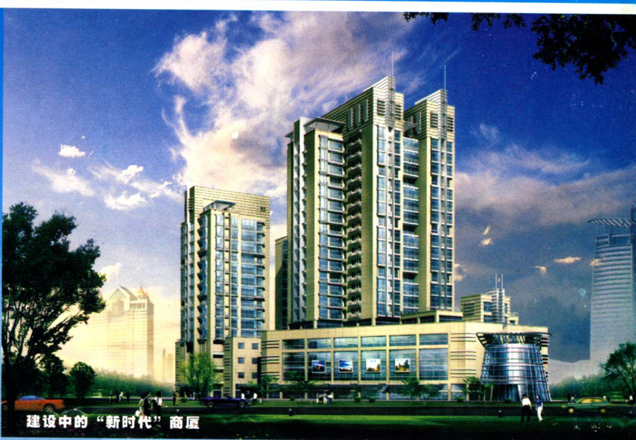
建设中的“新时代”商厦