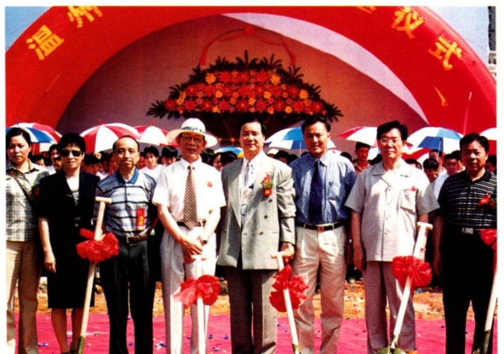
温州世贸中心奠基仪式