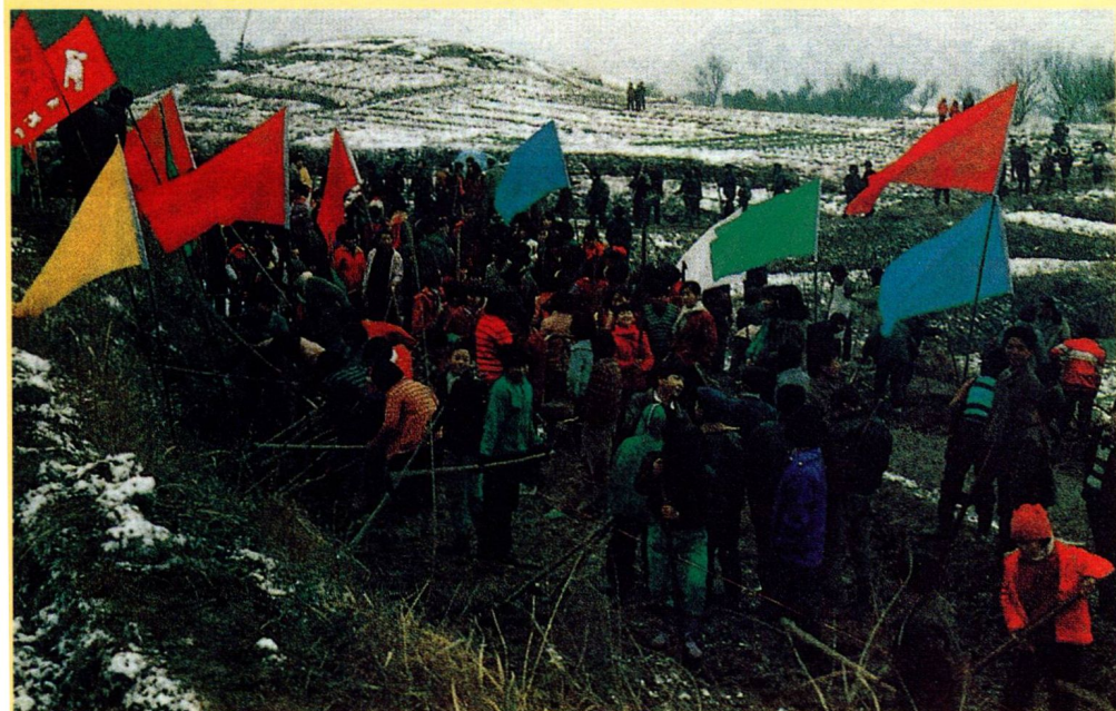
人民铁路人民建，大家共同来奉献

一个人在某一学科学有专长，尚不足为奇，但像南怀瑾先生这样，学贯东西，博通古今，集多学科于一身者实属罕见。南怀瑾先生以自己学术上的巨大成就，铸就了一代宗师的美名。