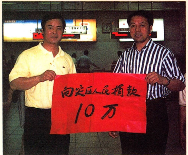
1999年带头向温州灾区捐款

艺术品贸易外，还投资了其他一些行业。他在温州设立了服装公司，在上海投资创办了“德泰”电器公司，在浙江仙居开办了“波特曼”工艺品公司。此外，他还是奥地利中国城贸易公司副董事长。他的贸易设想“中国货，美国卖”，“美国货，中国卖”。至今，第一个设想业已实现，第二个设想也正在成为现实。