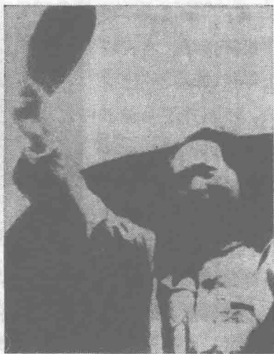
毛泽东飞赴重庆时在延安机场

虽然能进机场的人都是经过当局批准的，但是机场上仍然戒备森严。美军宪兵负责保卫工作，蒋介石还派了警卫组来帮助工作。