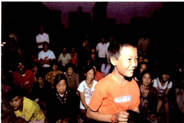
图1.5 孩子骑在大人脖子上看露天电影

现在的人们在观看电影、电视的过程中，不会因为头部、四肢等的特写镜头而感到惊奇或者恐惧。但是在电影被发明之前，人类是没有任何观影体验的。因此，当人们第一次看到屏幕上出现的物体和场景时，会有我们今天难以想象的反应。从《火车进站》开始，工业时代的人们在荧幕上看见火车进站的时候，恐惧和逃跑的情绪和行为恰恰表明了一个崭新的观影时代的到来。