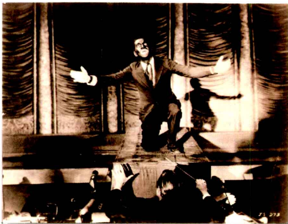
图1.1 世界上第一部有声电影《爵士歌王》剧照