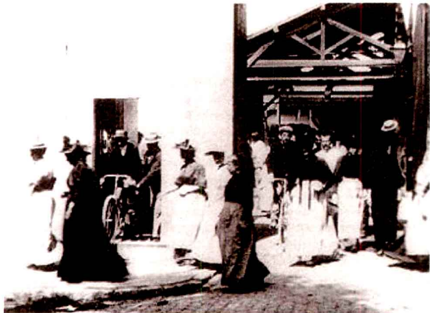
图1.4 《工厂的大门》中的画面