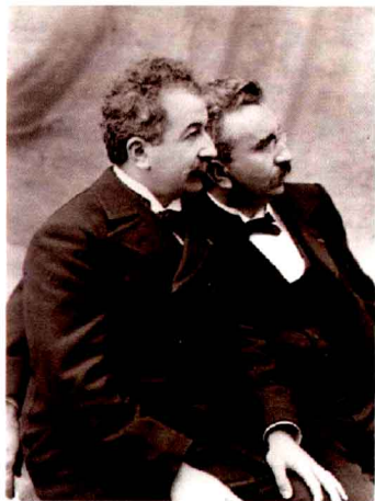
图1.3 成年的卢米埃兄弟