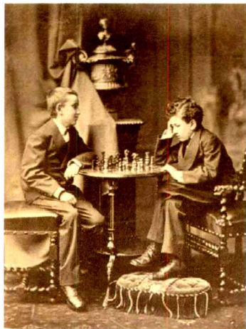
图1.2 童年的卢米埃兄弟

剧情： 《工厂的大门》表现了法国里昂卢米埃工厂放工时的场面，卢米埃工厂大门缓缓打开，一群头戴缎带羽帽、身穿紧身上衣、腰系围裙的女工走出来了，如图1.4所示。一群手推自行车的男工接着走出来。与这一百余名鱼贯而出的工人行走的方向相反，厂主乘坐由两匹骏马拉着的一辆马车进入工厂。女工们一边躲避车辆，一边轻盈地快步行走，表现出轻松欢乐的情绪。然后，工厂门卫走过来，关闭了工厂大门。影片创作意图表现鲜明。卢米埃用放工时工人队伍的浩大场面和欢快情绪，展现了工厂规模的宏大，以表达自己内心的喜悦和自豪。