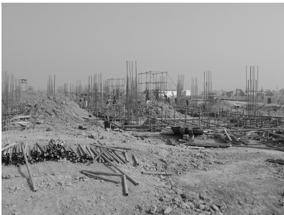
2005年11月1日,基础施工阶段(二)