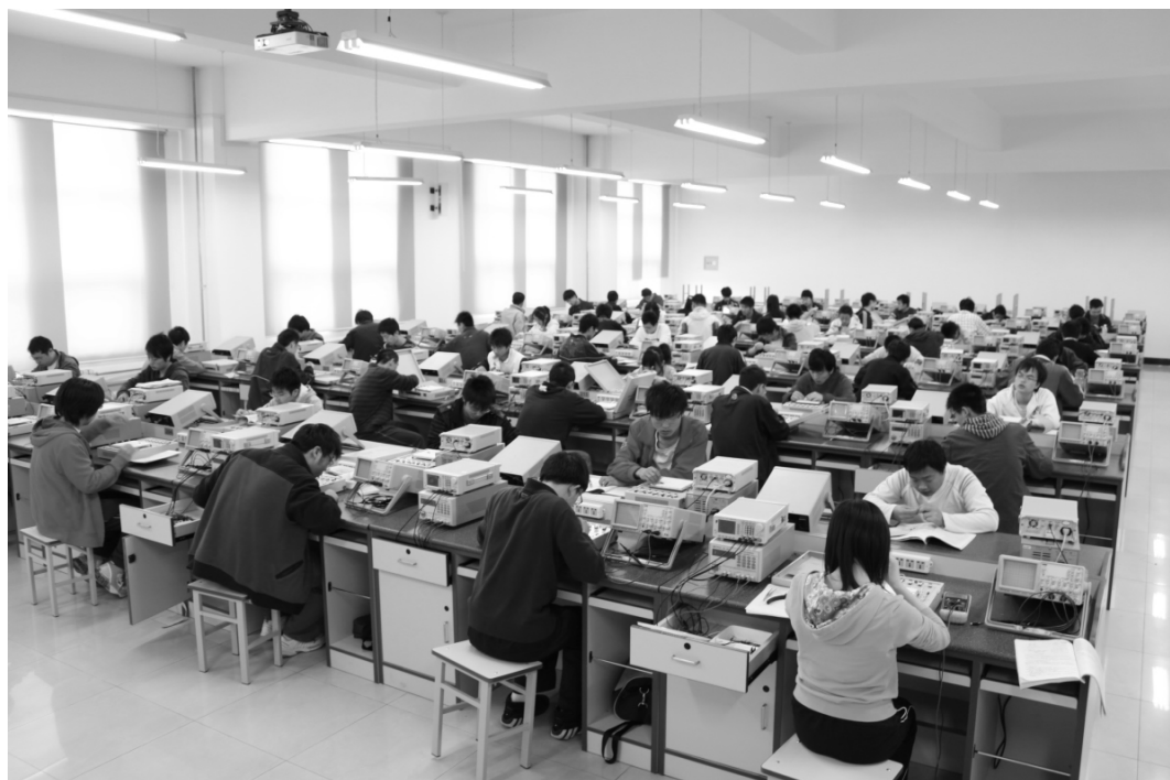
电工电子教学实验中心(二)