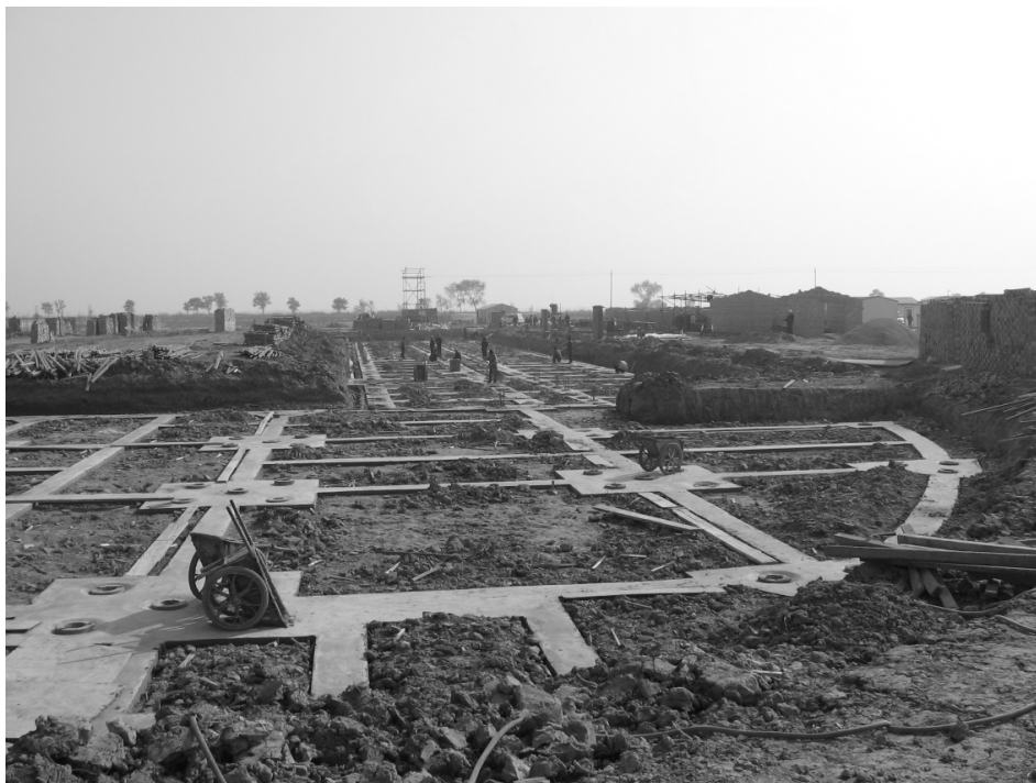
2005年11月1日,基础施工阶段(一)