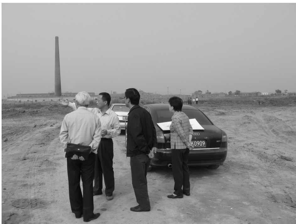
2005年9月27日,仁爱集团和天津大学仁爱学院领导在学校施工现场听取工程部人员介绍工程进展