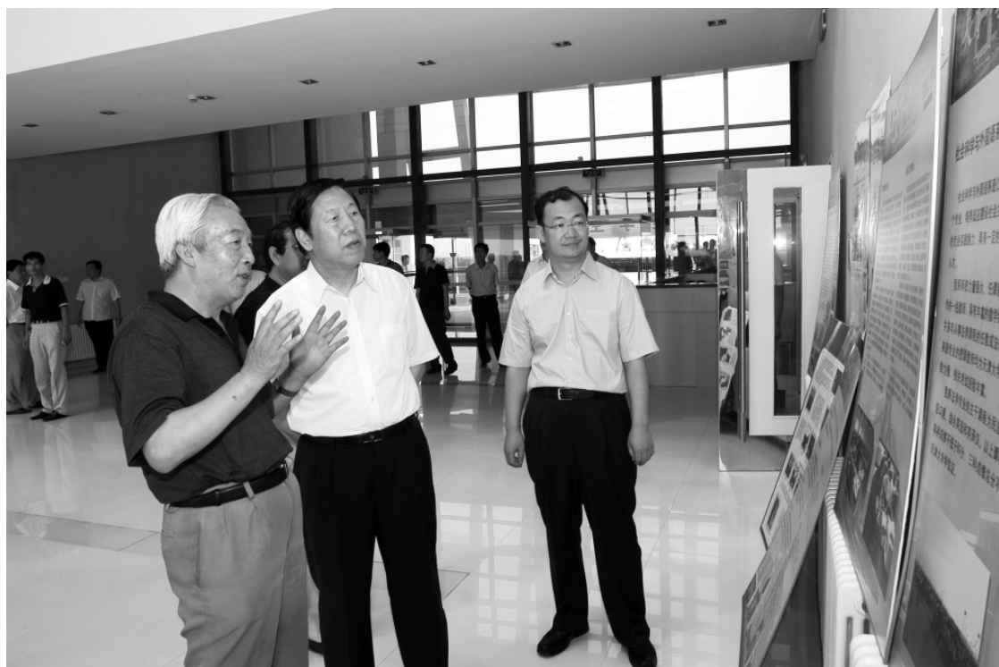
2007 年 8 月 5 日,天津市市长戴相龙 视察天津大学仁爱学院,仁爱集团董事长马如仁先生、院长武星教授陪同