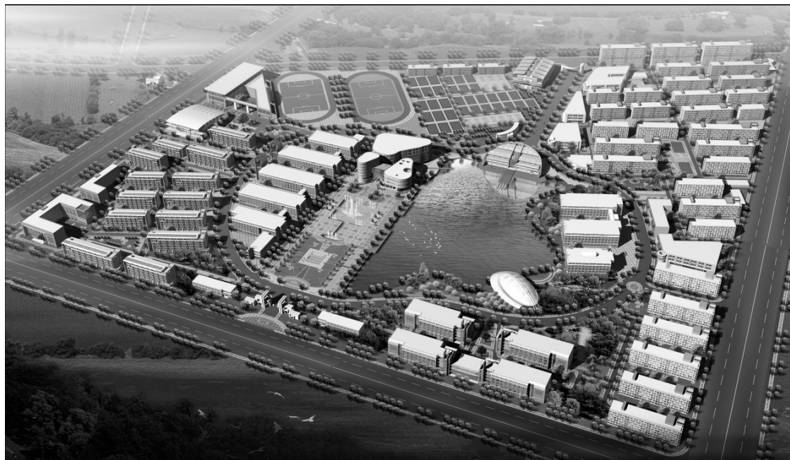
天津大学仁爱学院 2006 年规划效果图