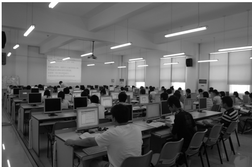
计算机教学与实验中心一角