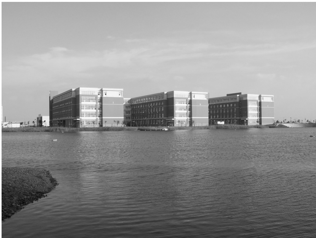
第一、二教学楼与实验楼