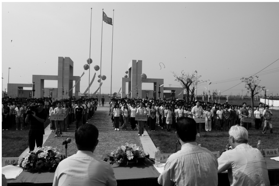
天津大学仁爱学院首届开学典礼(二)