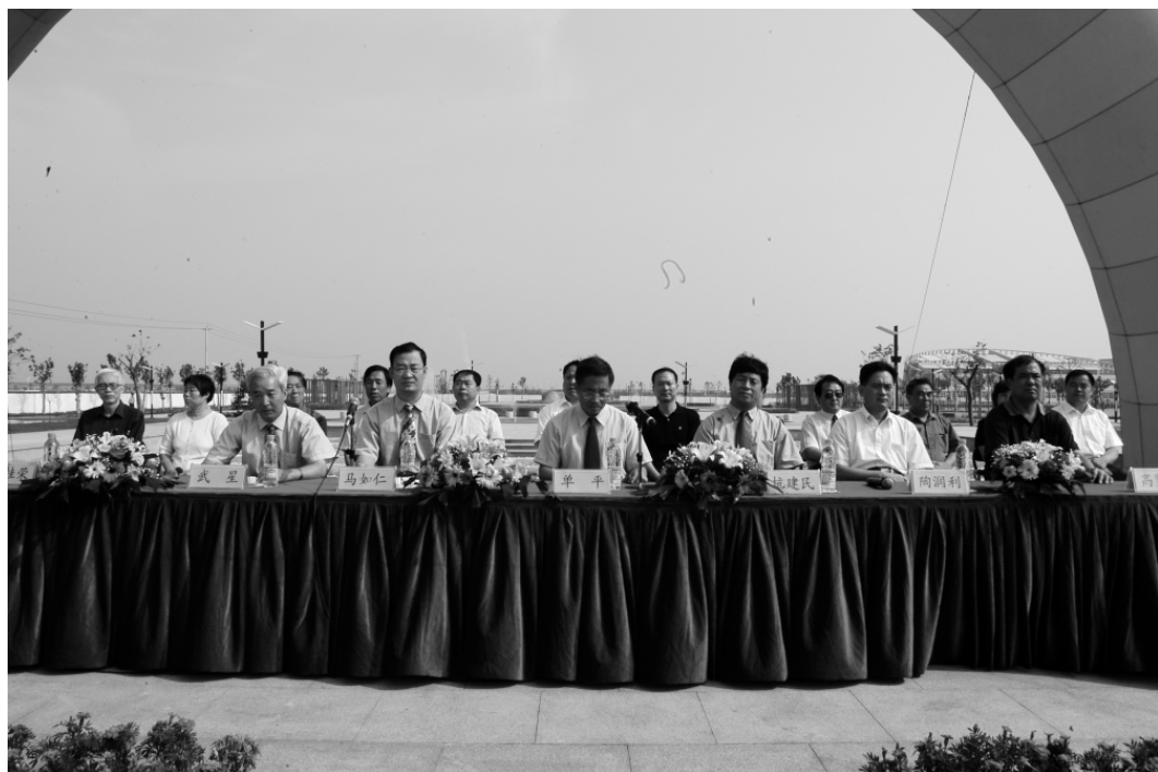
天津大学仁爱学院首届开学典礼(一)