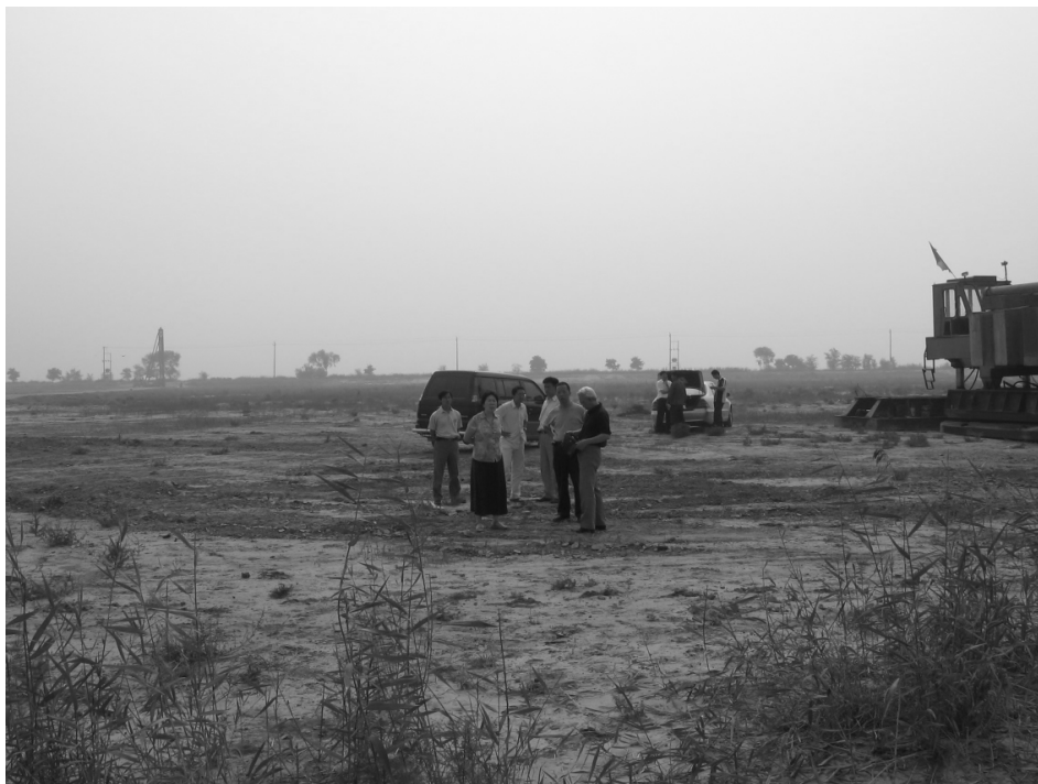
2005年9月12日,天津大学仁爱学院领导检查即将开工建设的学校工地