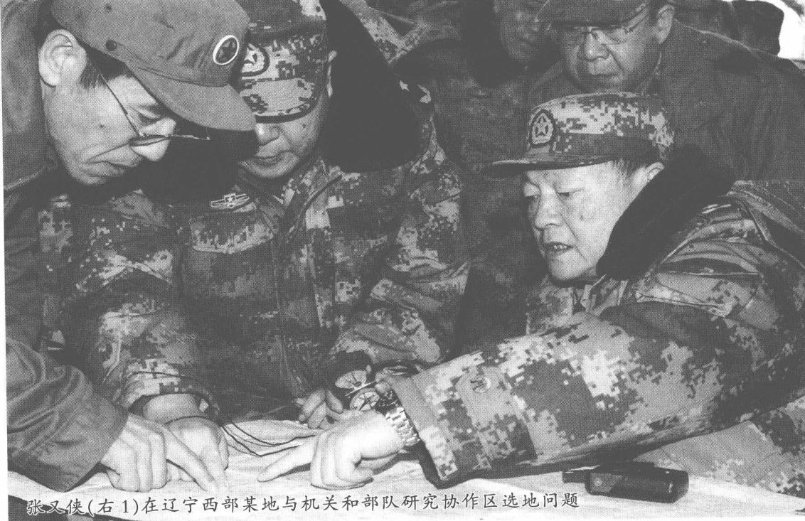
张又侠(右1)在辽宁西部某地与机关和部队研究协作区选地问题

打转转了。在深入学习贯彻党的十七大精神过程中,我们越来越清醒地认识到,要突破“瓶颈”走出困境,就必须从党的特色理论中寻求答案,其中最重要的一条就是解放思想。改革开放30年的伟大实践已经证明,解放思想是开启发展之门的“金钥匙”。