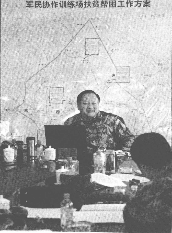
张又侠部署军民协作 训练场扶贫帮困工作