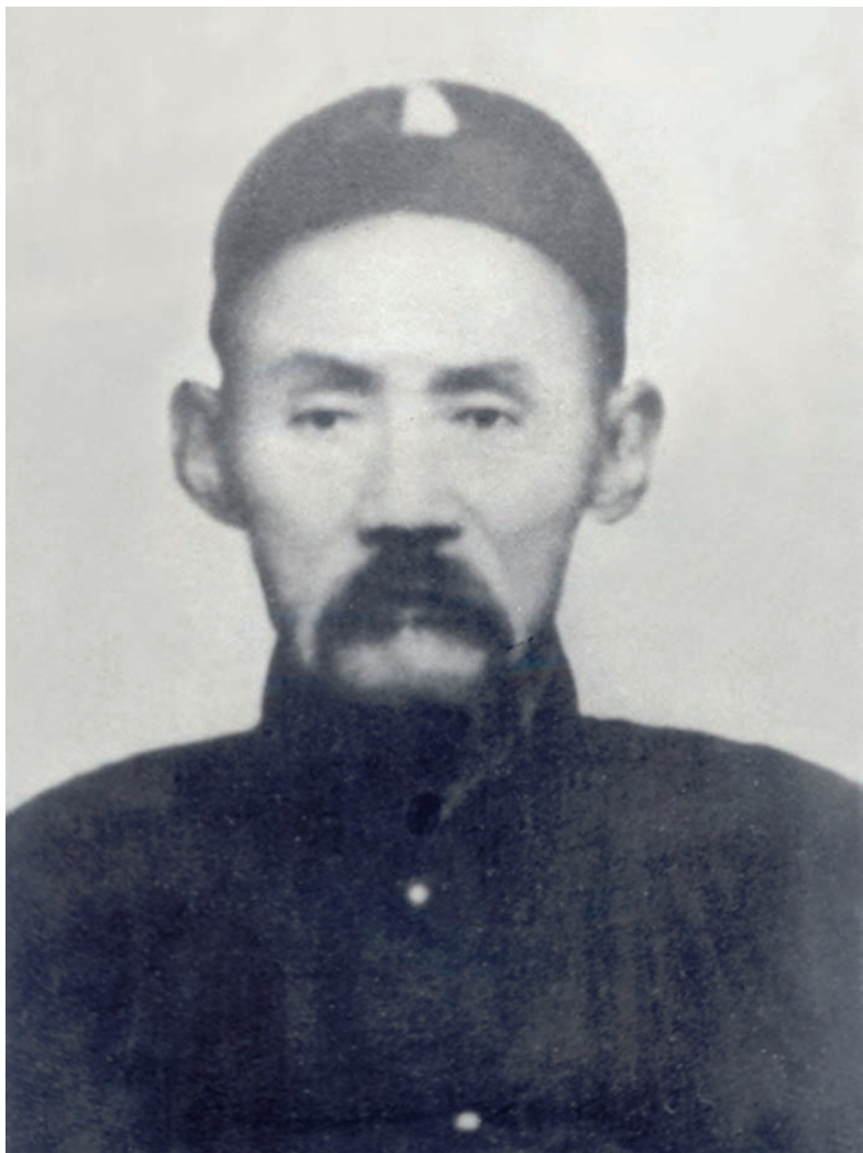
尹福 (1842—1911) 无极八卦门第二代门长