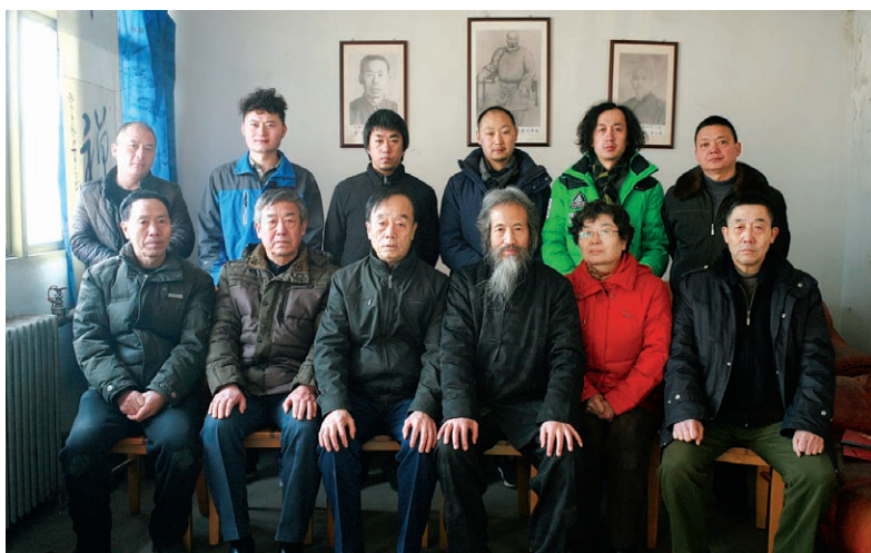
作者 2016 年收徒仪式合影