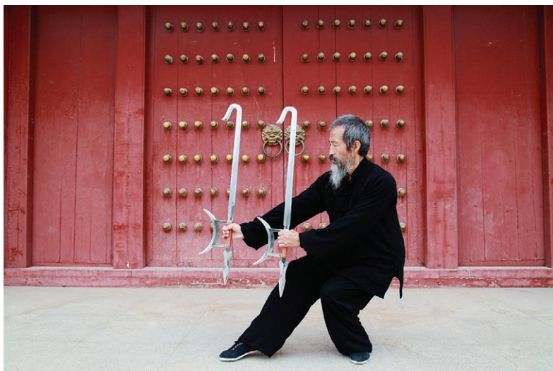
作者习练无极八卦双钩