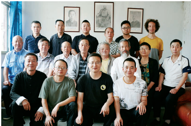
作者 2014 年收徒仪式合影