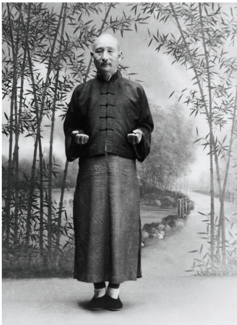
卢空隐 字书魁，号山峰