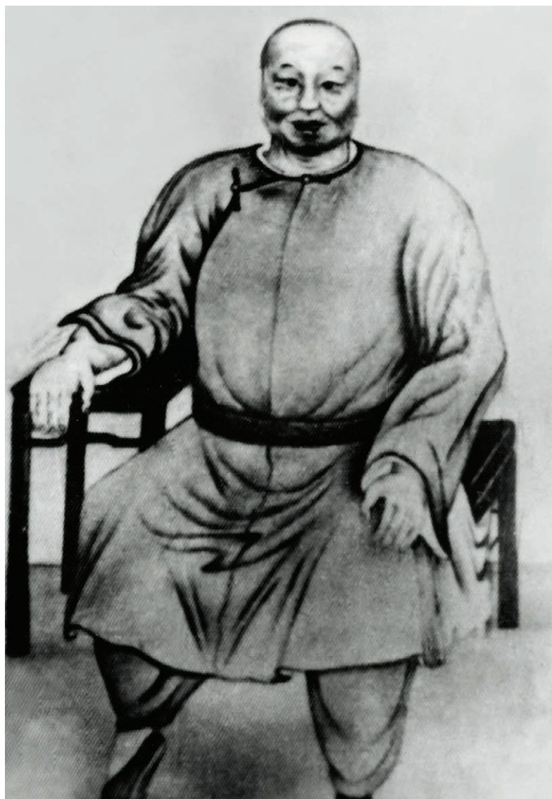
董海川 (1800—1880) 无极八卦掌宗师