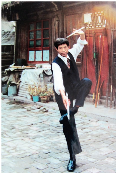
作者于1995年在先师家的院子练阴阳双笔