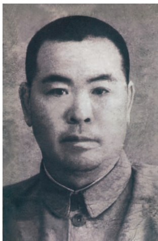
王子秋 号永艮 第五代