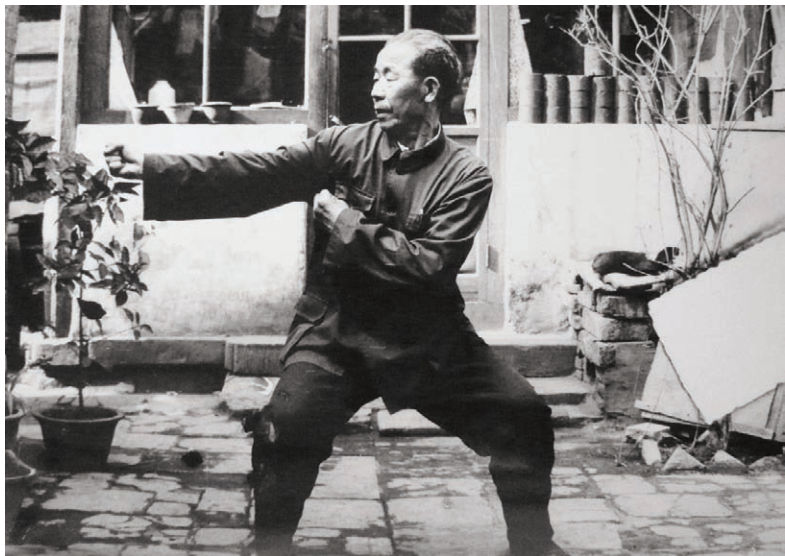
刘元 字志斋，号永乾