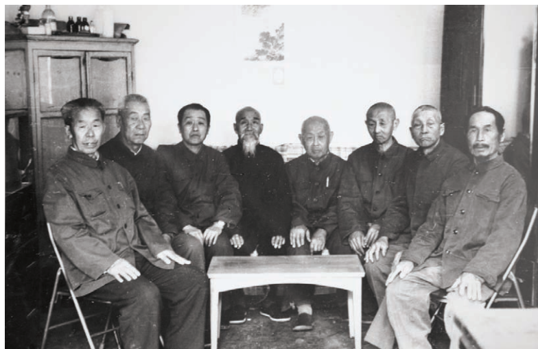
四代五代传人合影