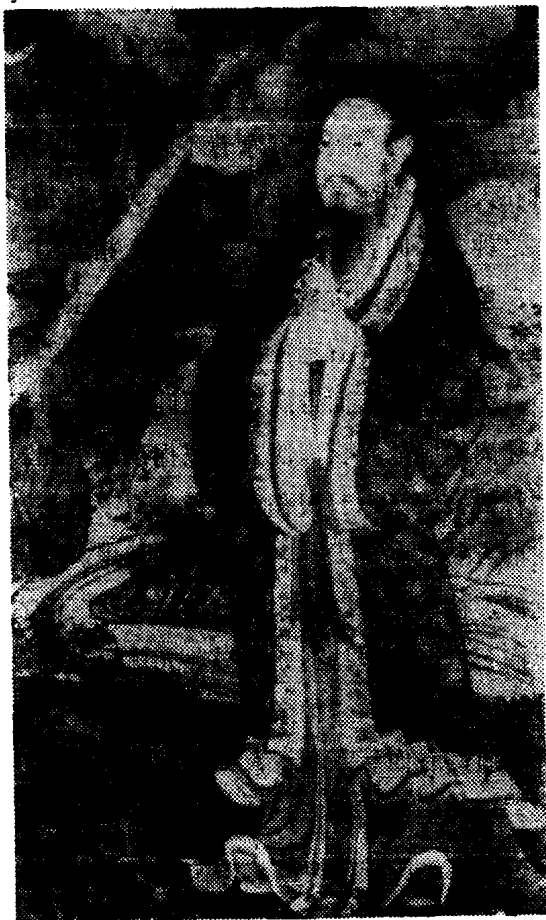
信士（法海寺壁画局部） （石景山区政协供稿）

实，生意盎然。特别是“帝释梵天图”、水月观音和佛会图，艺术价值很高。所绘人物极富精神和性格特征，如梵天的肃穆，天王的威武，功德天的聪惠，柯利帝母的慈祥，毕哩孕迦的天真，表现生动，结构巧妙，线条流畅，沥粉贴金，金碧辉煌。