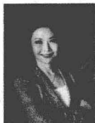
陶思璇 著名心理专家 陶氏英合首席签约专家