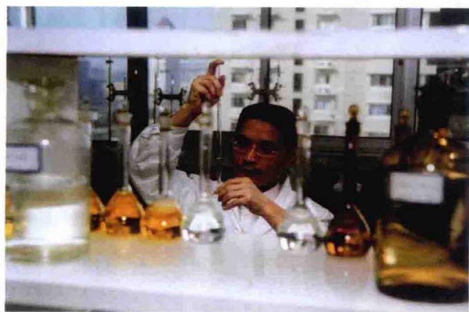
理化检测室工作现场