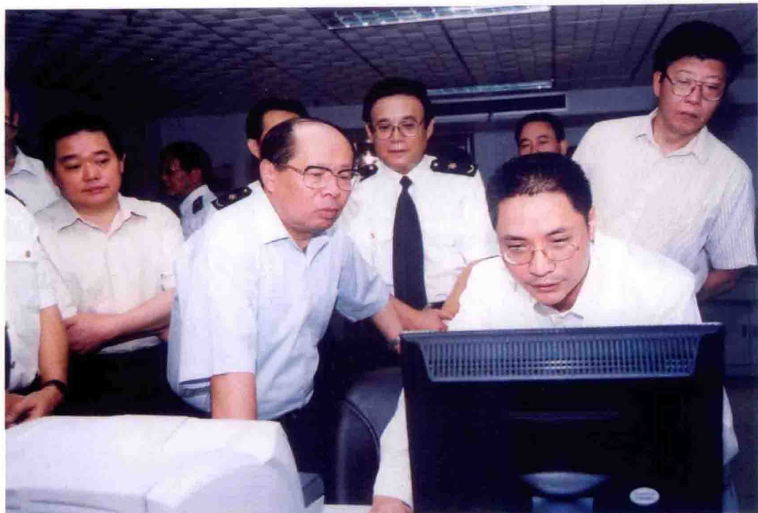
2004年8月，中共重庆市委书记黄镇东(左二)到重庆出入境检验检疫局视察工作