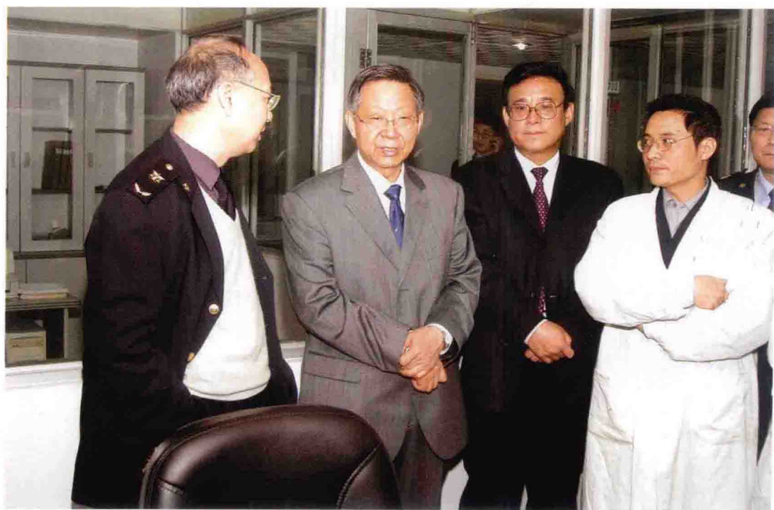
2004年4月，国家标准委主任李忠海（左二）到重庆出入境检验检疫局视察