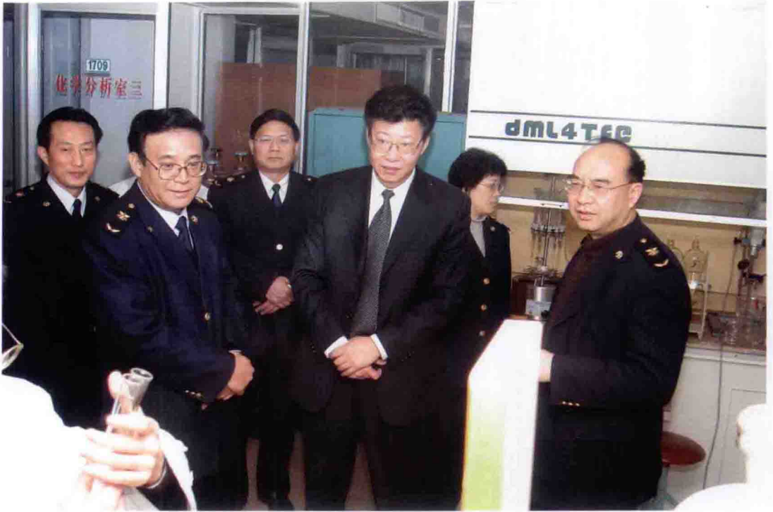
2005年2月，重庆市副市长吴家农（右二）视察重庆出入境检验检疫局