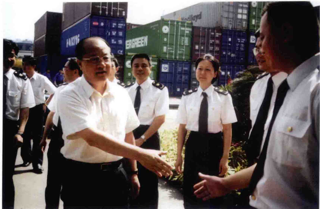
2000年5月，国家质检总局局长李长江（前左）视察重庆九龙坡港出入境检验检疫局