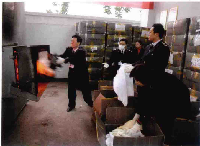
焚烧销毁进口旧服装