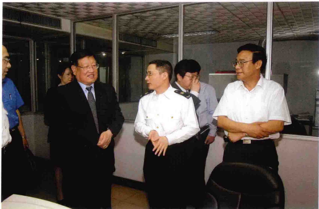
2004年4月，国家质检总局副局长王秦平（右三）视察重庆出入境检验检疫局