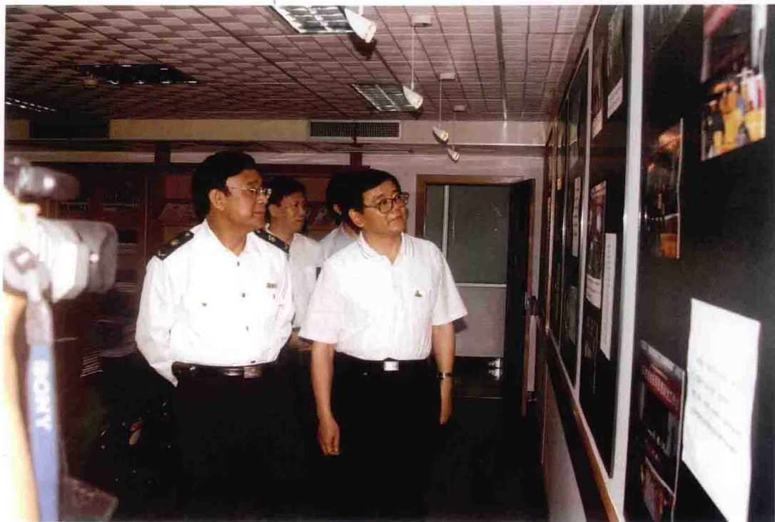
2006年，国家标准委主任刘平均(右一)视察重庆检验检疫局职工之家