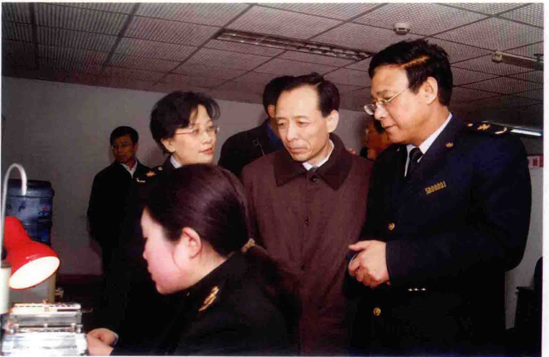
2005年，国家质检总局副局长蒲长城（右二）视察重庆出入境检验检疫局