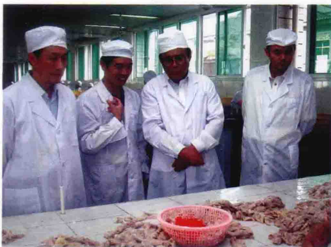
重庆出入境检验检疫局局领导带队深入出口肠衣生产企业调研