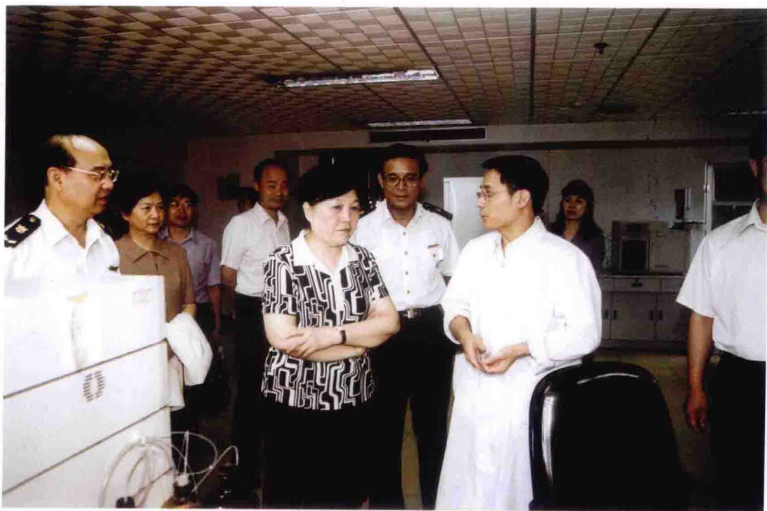
2003年6月，国家认监委主任王凤清(前排中)视察重庆出入境检验检疫局