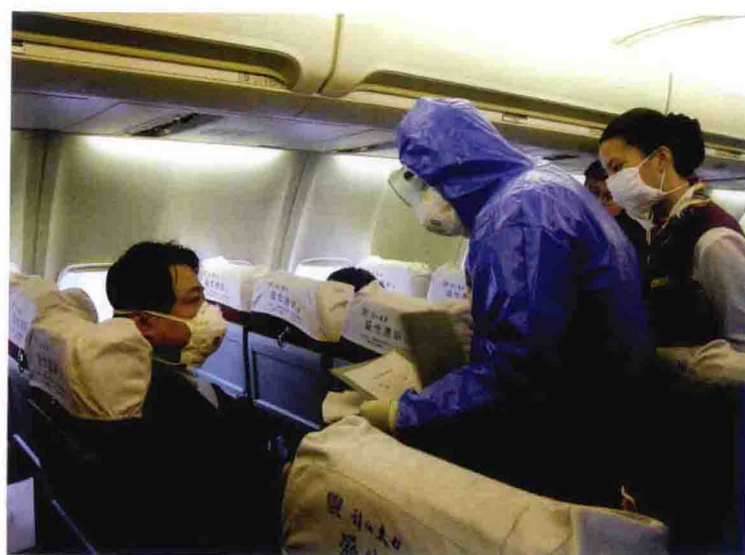
“非典”期间，组织开展应急预案演习活动