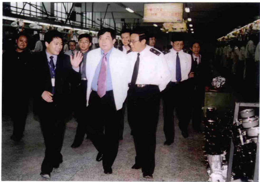
2002年5月，国家质检总局党组书记李传卿（前排中）视察重庆出口企业