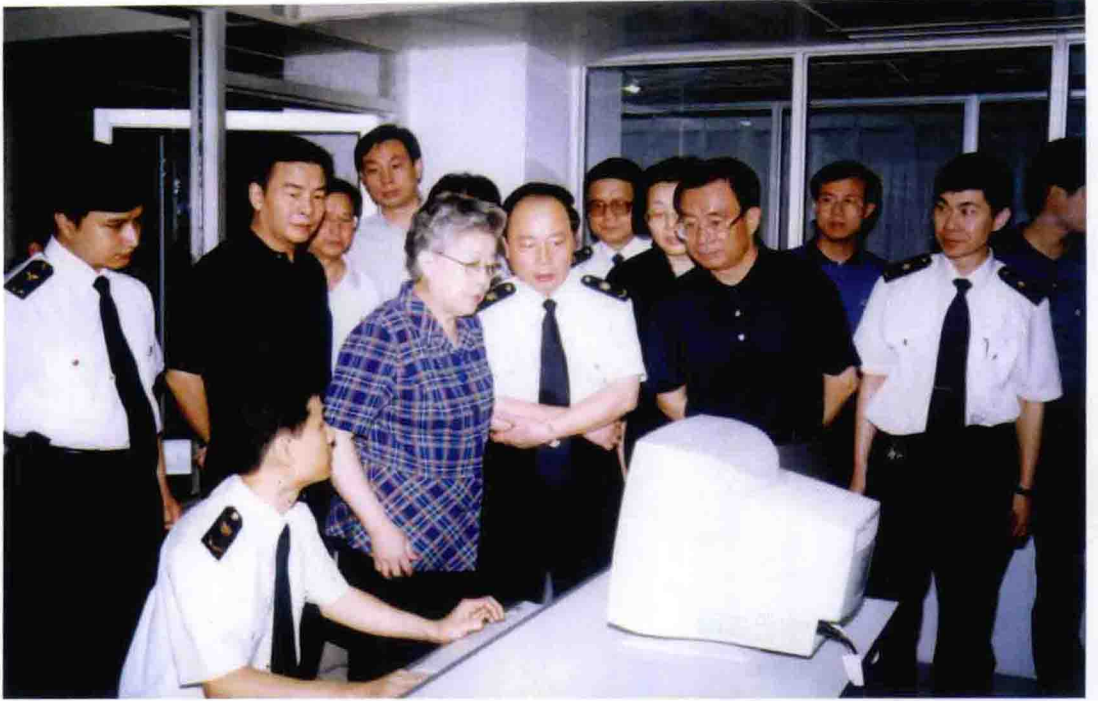
2000年7月，中共中央政治局候补委员、国务委员吴仪视察重庆出入境检验检疫局