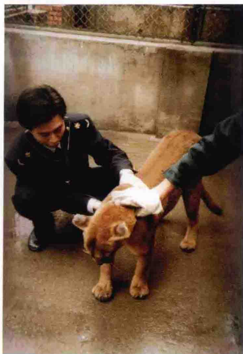
对进境动物实施隔离检疫