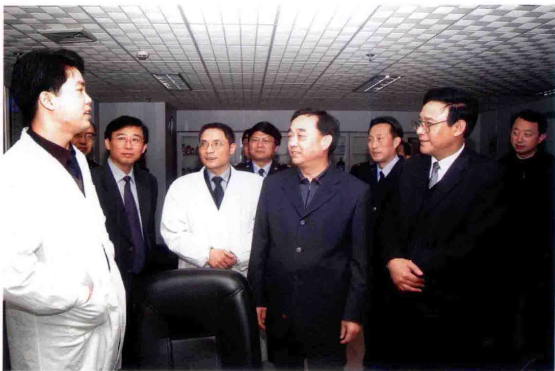
2004年3月，国家质检总局副局长葛志荣(前排右二)视察重庆出入境检验检疫局