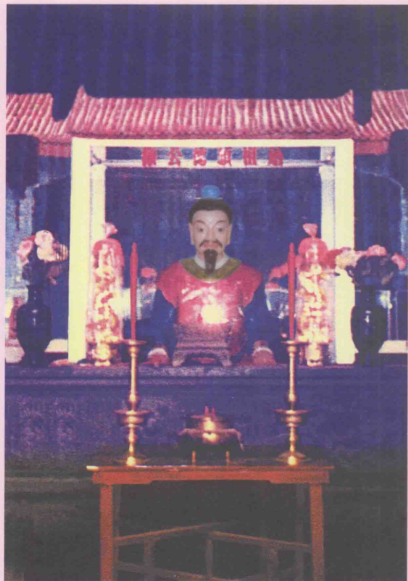
六桥林氏入闽始祖林硕德塑像