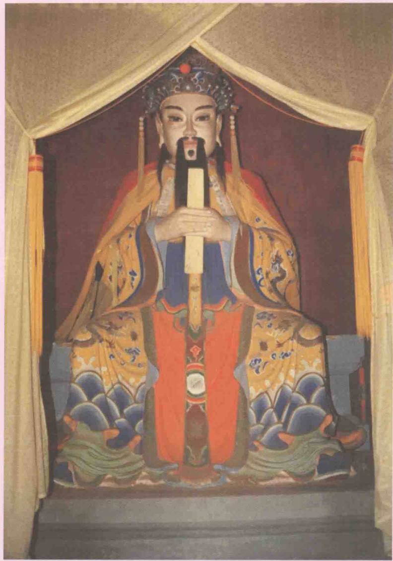
河南省卫辉市比干庙林姓太始祖比干像