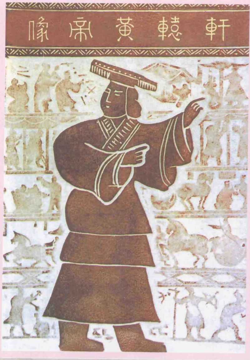
陕西省黄陵轩辕庙轩辕黄帝像