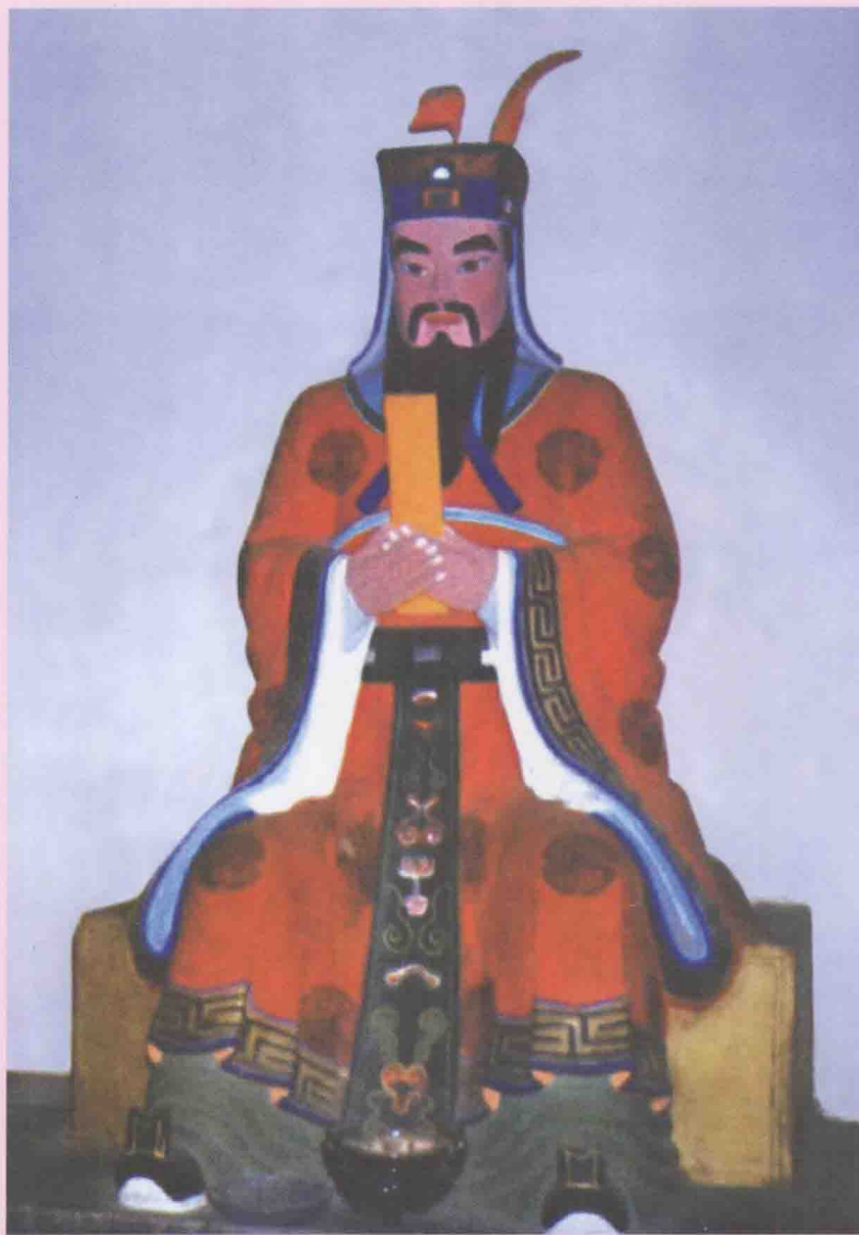
河南省卫辉市比干庙得姓祖林坚像