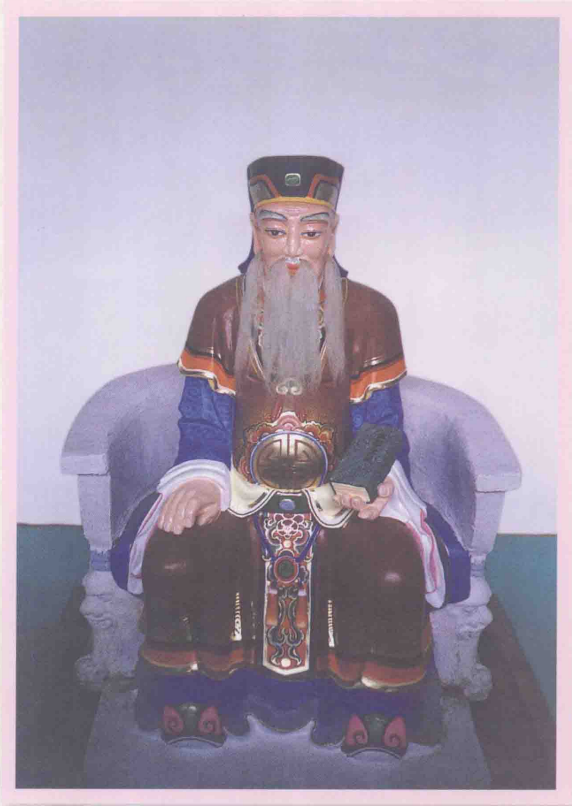
六桥林氏发祥祖颐山公塑像