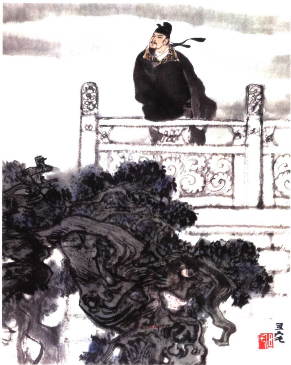
陈子昂登幽州台（刘旦宅）