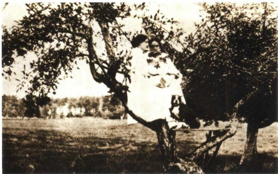
海伦·凯勒与老师莎莉文