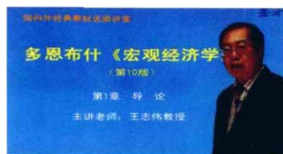
北京大学王志伟教授