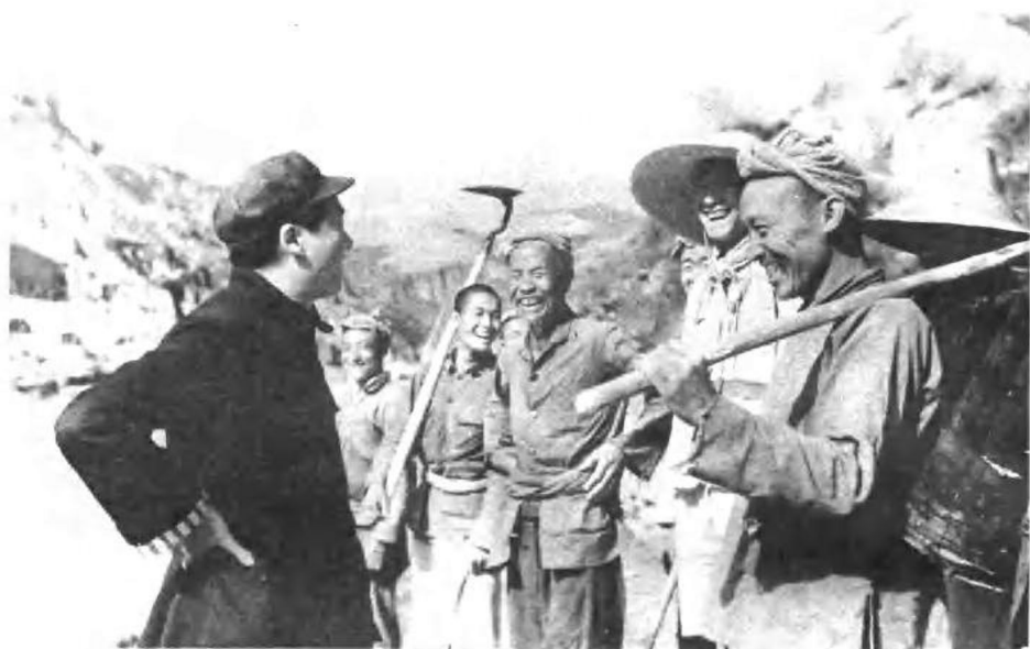
1939年毛泽东在延安杨家岭与农民谈话