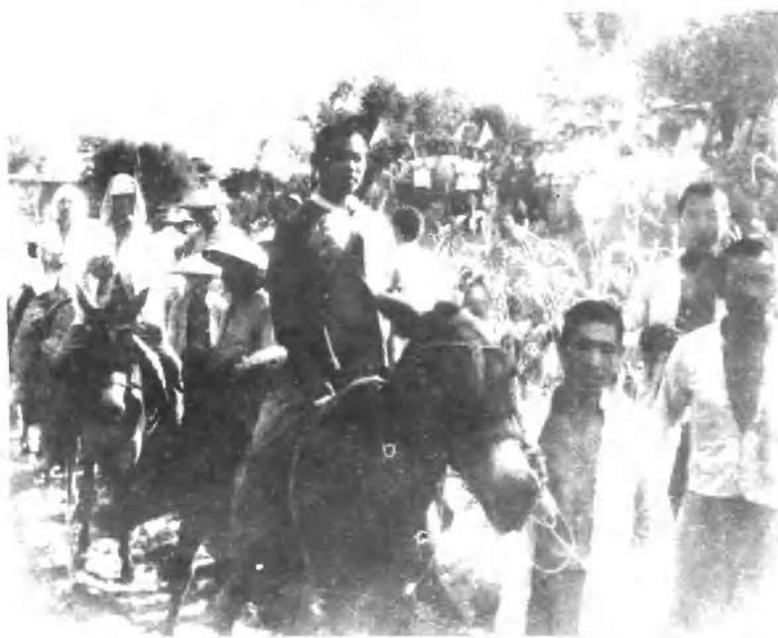
陕甘宁边区农民踊跃参加八路军