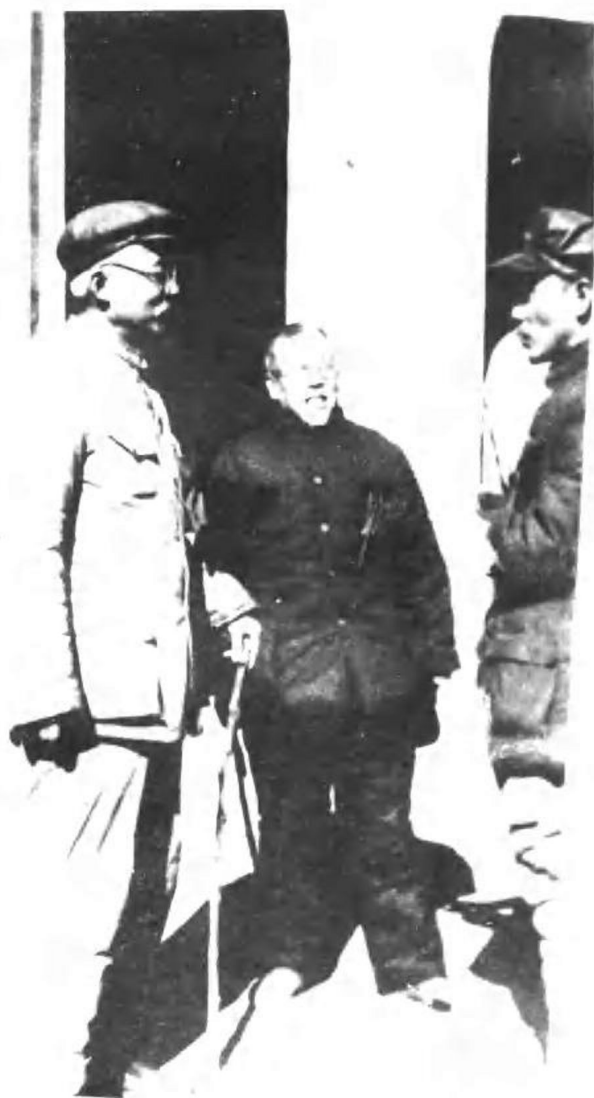
林伯渠（左）、谢觉哉（右）在延安