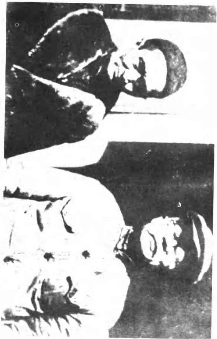
林伯渠（右）、李鼎铭（左）在延安