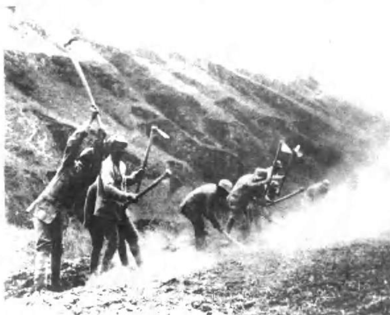
三五九旅战士在开荒