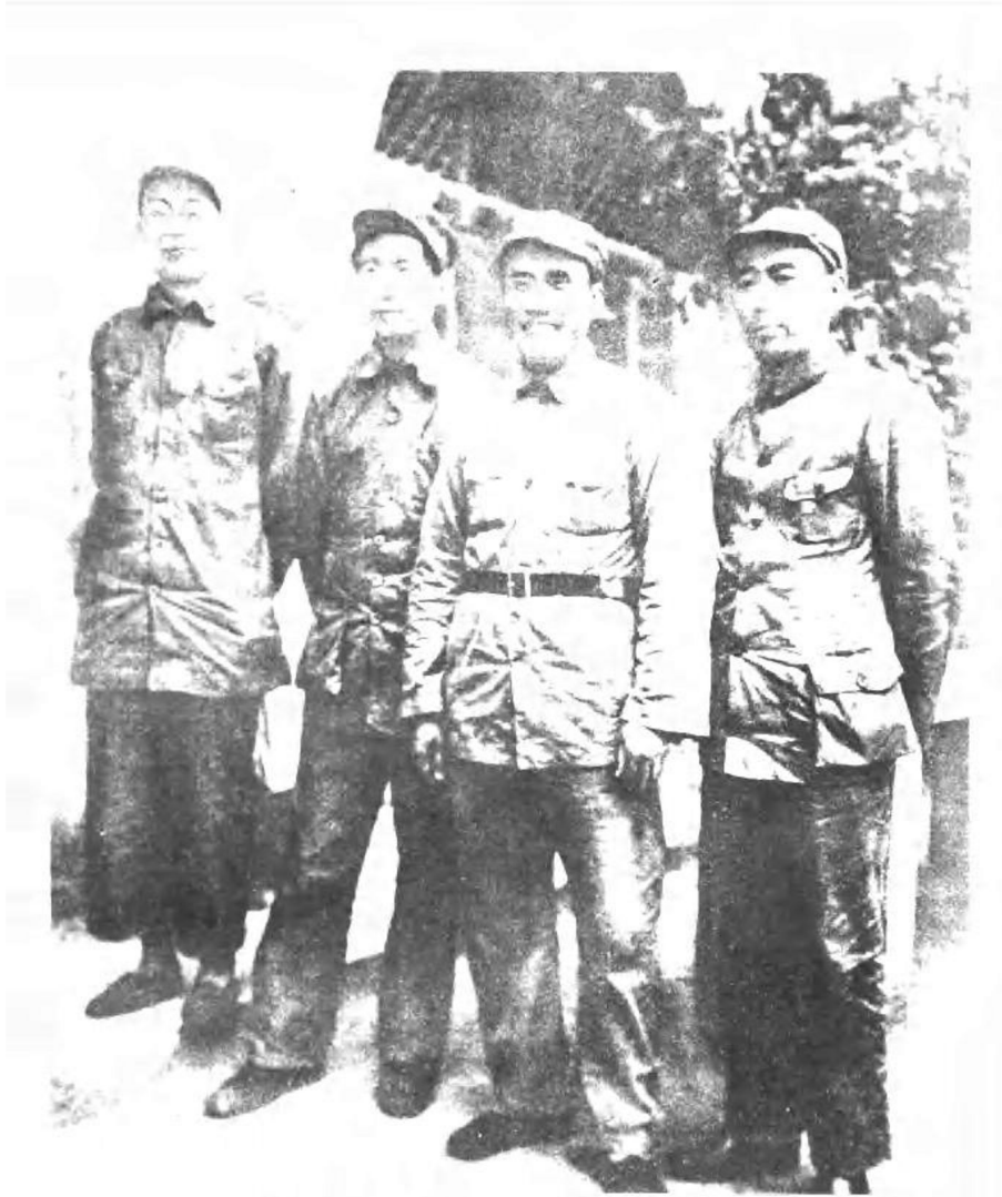
1937年5月尼姆·威尔斯女士在延安为毛主席和周恩来、朱德、林伯渠同志拍摄的一张合影