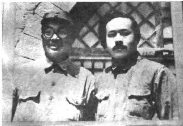
整风时期任弼时、贺龙在延安杨家岭