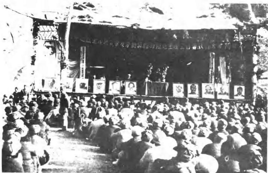
陕甘宁边区生产展览会及劳动英雄与模范生产工作者大会会场