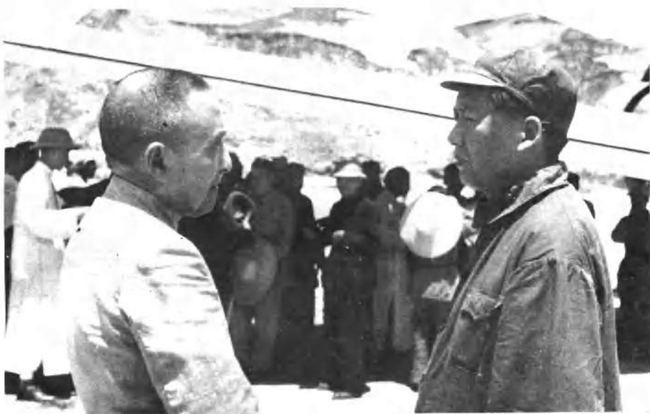
毛泽东1945年7月在延安机场与国民参政会参政员黄炎培交谈