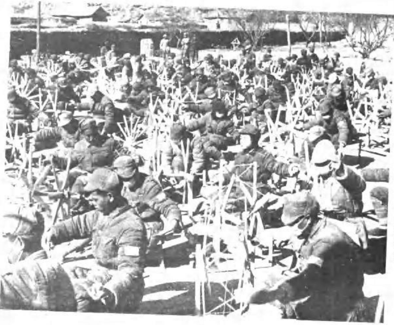
机关干部自力更生纺纱织布