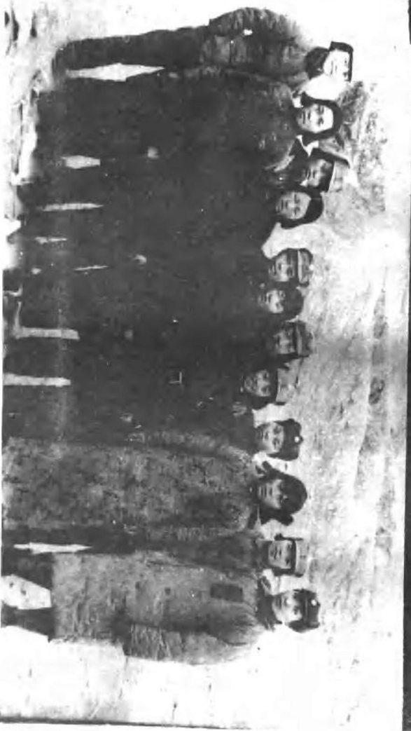
中央婦女代表招待陝甘寧邊區參議會女參議員留影