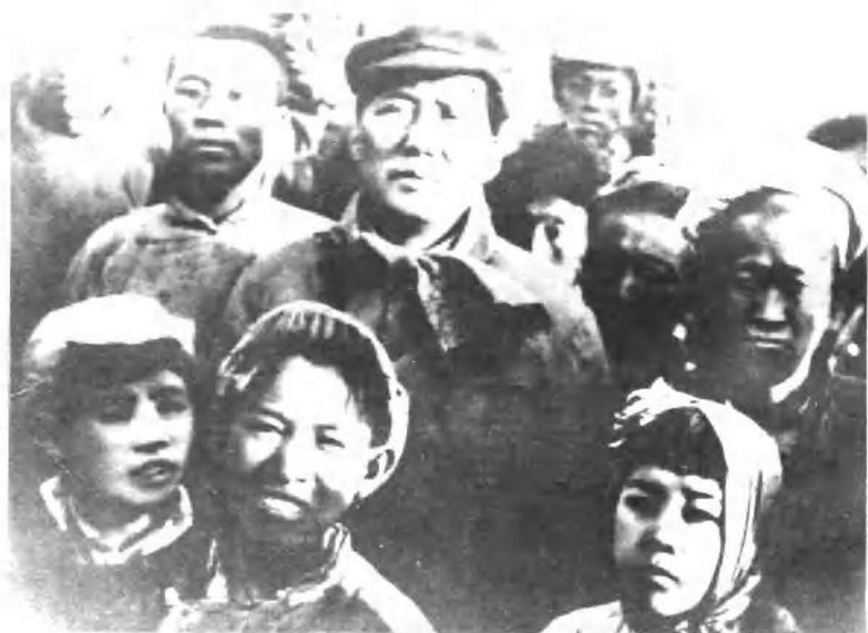
毛泽东与六乡秧歌队员合影