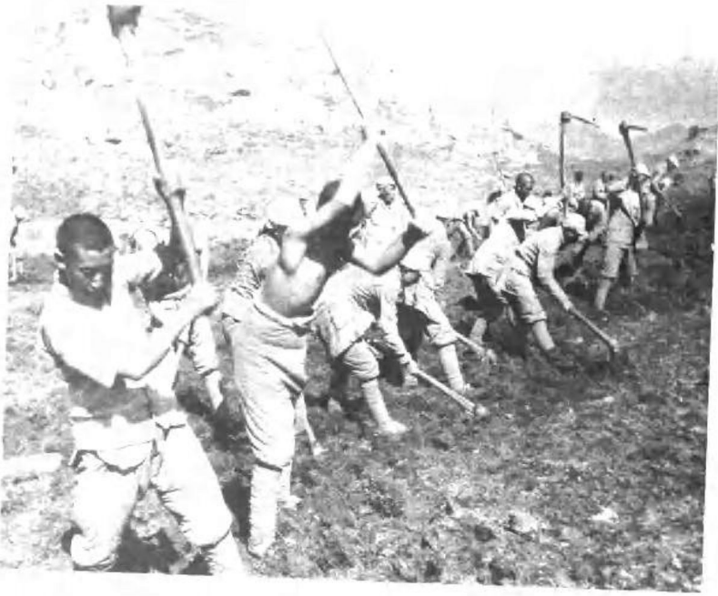
机关干部参加大生产运动