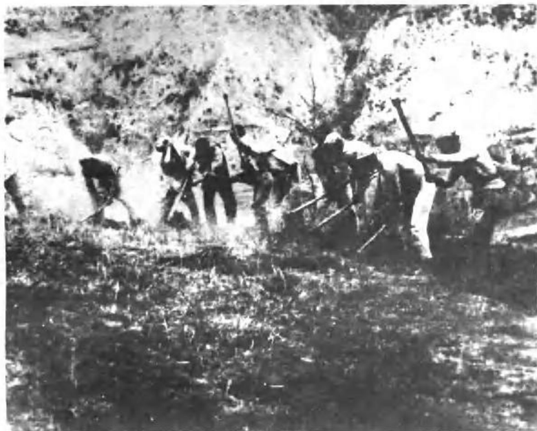
延安农民变工队在进行生产互助