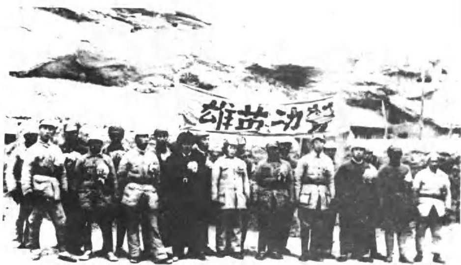
出席陕甘宁边区劳模大会的八路军劳动英雄