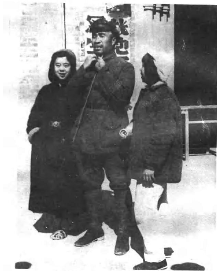
1940年10月10日，朱德与鲁艺学员合影