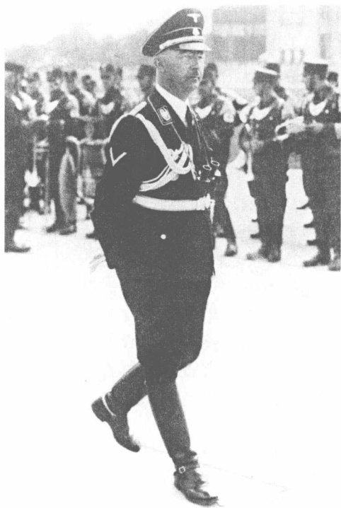
纳粹德国的重要人物希姆莱

一切细节都考虑得有条不紊，“进攻”在规定的时间内进行了。8月31日下午4时，在海德里希的亲自布置下，从纳粹集中营中拉来了十几名死囚，让他们全部穿上波兰的军服，并给他们配备了波军的武器，缪勒对那些将被杀害的判刑者保证说，由于他们为了祖国参加这次行动，因而应该受到赦免和释放。接下来，由一小队身着便装的党卫队，在一个叫约克斯的党卫队军官的率领下，将这一批“波兰军人”拉到波德边境的树林里杀死，只保留了一名死囚，身着波兰军服的党卫队押着这名幸存的死囚，冲进位于德波边境的格莱维茨电台，然后让翻译掏出早就准备好的讲话稿，对着麦克风用波兰语进行播音，就这样，