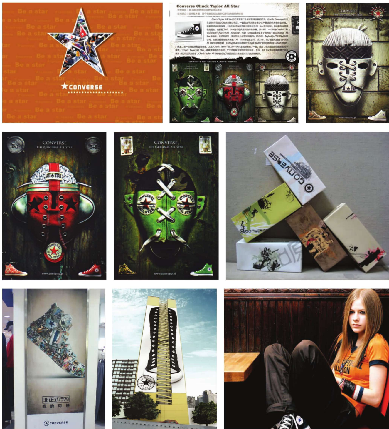
图 1-1-1 匡威品牌形象设计