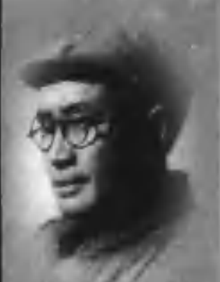
国民革命军第八路军 第129师师长 刘伯承元帅

刘伯承 同志和我一起工作， 是1938年在八路军129师，一个师长， 一个政治委员。人们习惯把“刘邓”连在 一起，我们也觉得彼此难以分开。