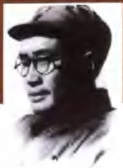
国民革命军第八路军 129师师长刘伯承元帅