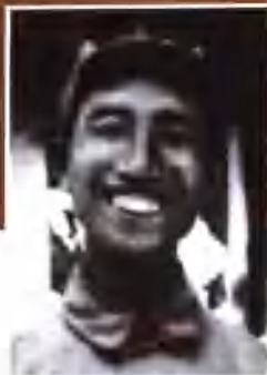
八路军129师副师长 徐向前元帅