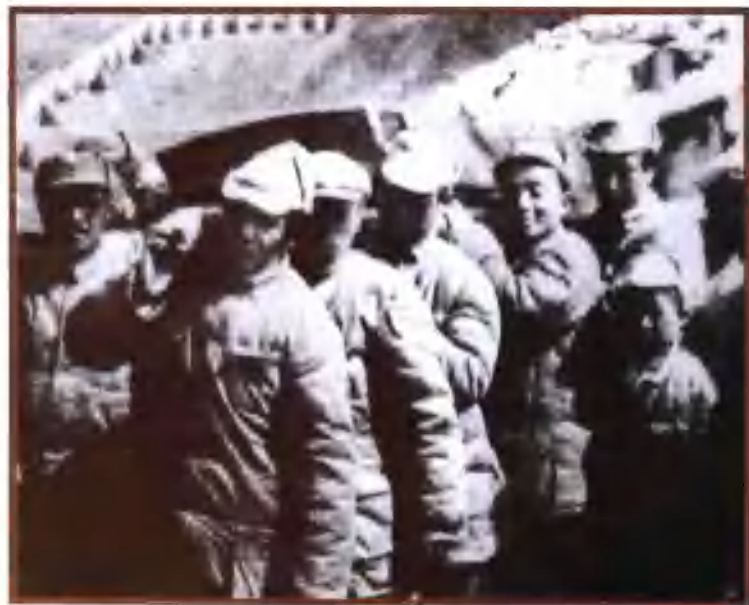
毛泽东等为病逝的八路军129师原政委张浩送殡(从左至右):贺龙、毛泽东、彭真、杨尚昆、陈云。