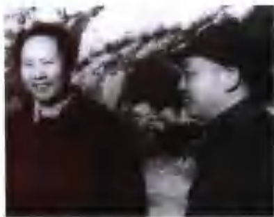
毛泽东和八路军副总司令彭德怀在延安。