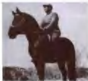
朱德总司令在山西武乡县八路军驻地。