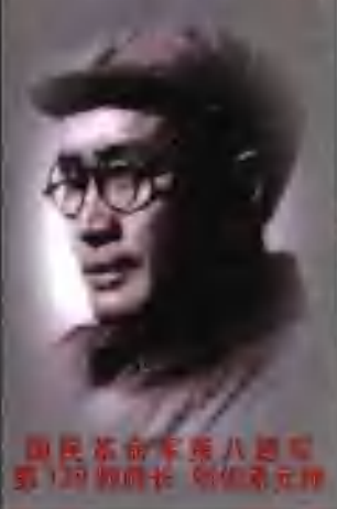
国民革命军第八路军 第129师师长 刘伯承元帅

同志和我一起工作， 是1938年在八路军129师，一个师长， 一个政治委员。人们习惯把“刘邓”连在 一起，我们也觉得彼此难以分开。