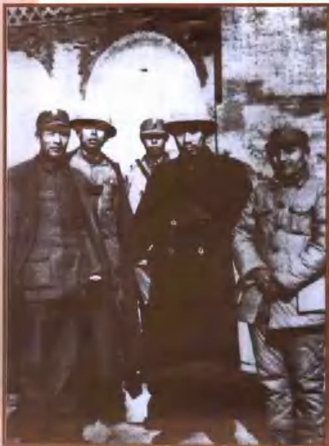
1937年秋，邓小平（右一）、周恩来（右二）、彭雪枫（右五）等在山西前线。