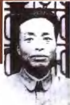
八路军129师原政委 张浩将军