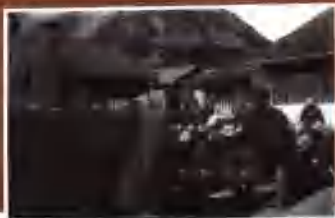
1937年9月，邓小平在延安抗日军政大学作报告。右坐板凳者为抗大校长林彪。