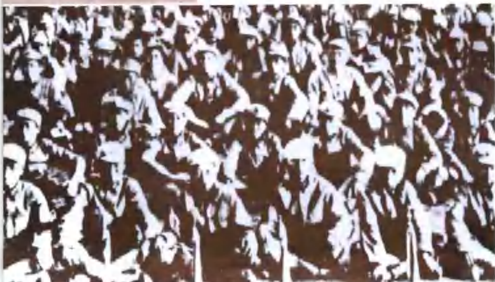
1936年10月,长征到达陕北的八路军129师之前身的主要部队——红四方面军的一部分。