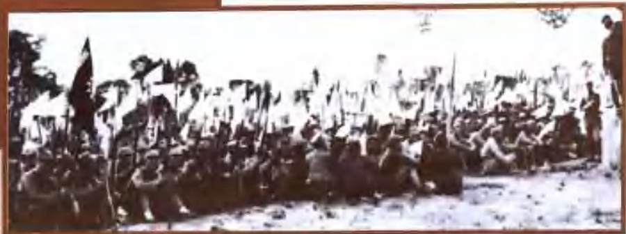
1937年9月，整编之后，整装待发，准备东渡黄河抗日的八路军129师。