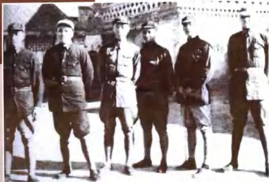
1936年2月,东征抗日前的红军将领。左起:左权、彭德怀、聂荣臻、陈赓、孙毅、聂鹤亭。