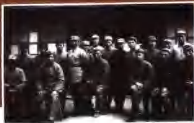
1937年春，朱德、毛泽东和中国人民抗日军政大学部分人员合影。