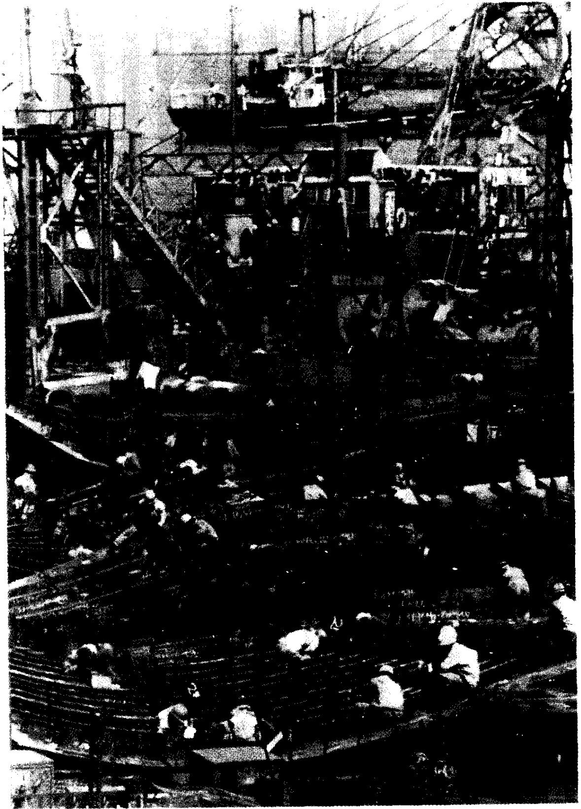
图 1-1 20 世纪 60 年代日本的造船工业