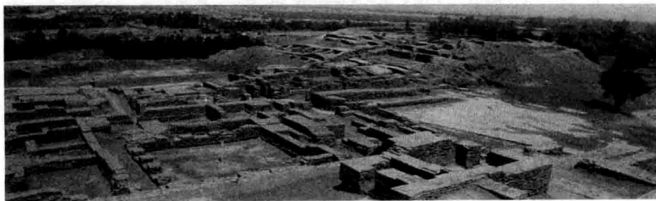
●摩亨佐·达罗古城遗址