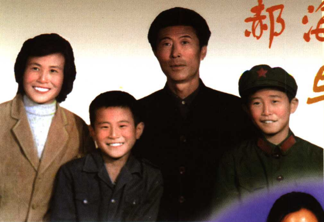
(上) 小海东与他的父母和弟弟