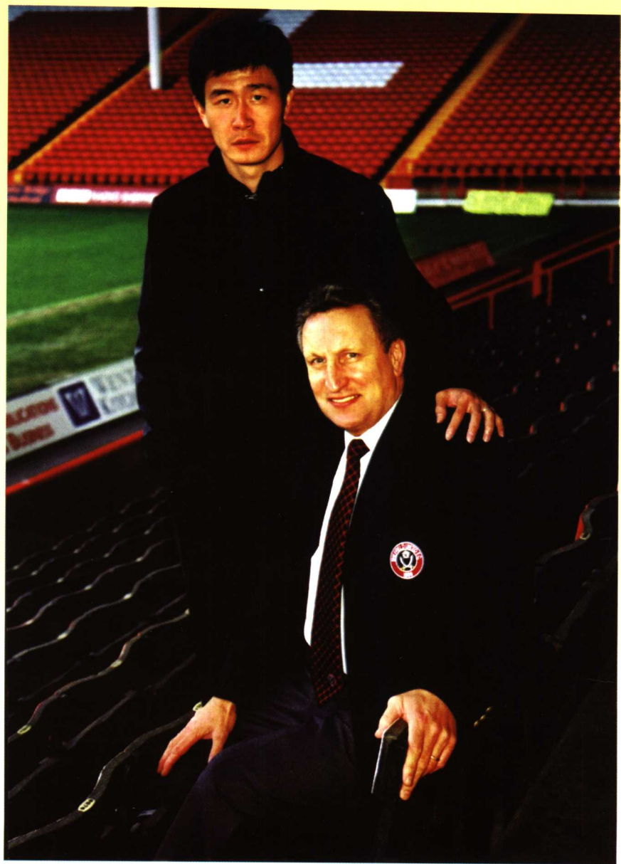
郝海东与谢菲尔德俱乐部主教练合影