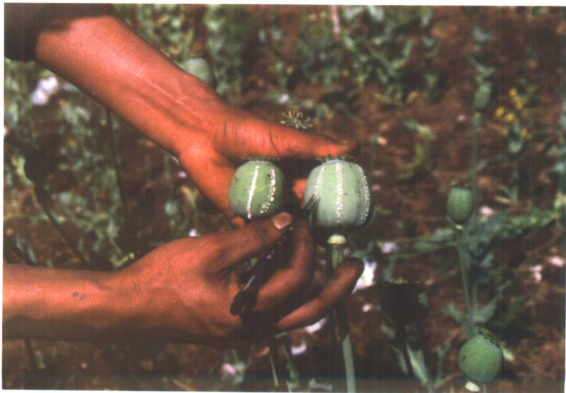
从罂粟果割取鸦片