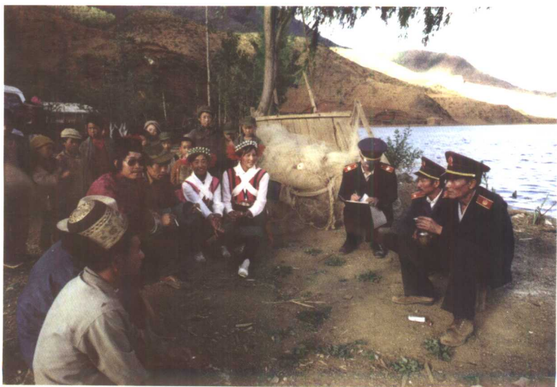
禁毒宣传走上田间地头