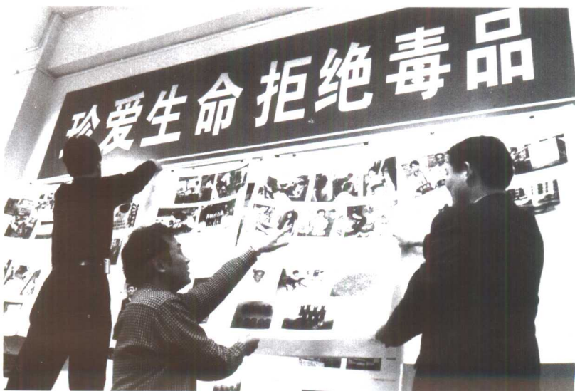
筹备中的全国禁毒展览