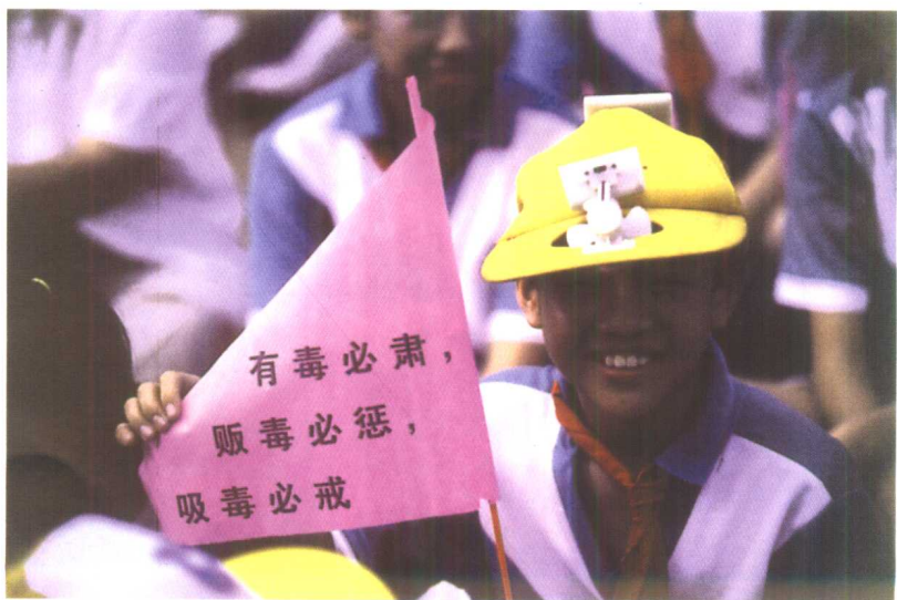
青少年对毒品说：不！