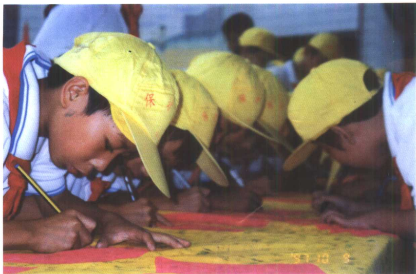
生命的承诺：珍爱生命 远离毒品