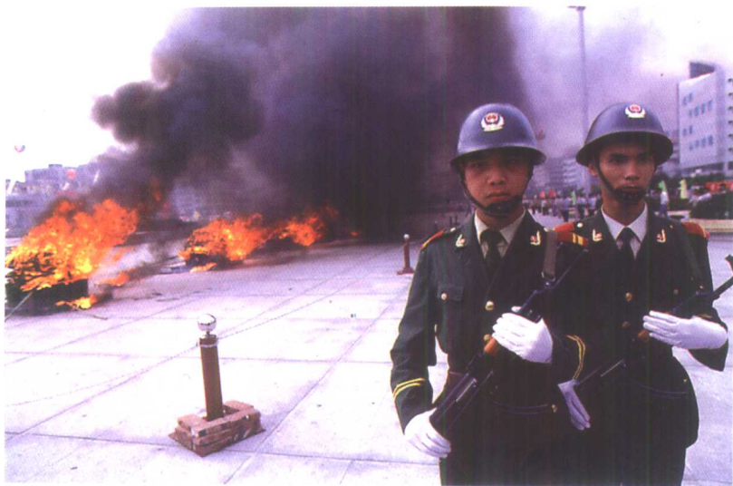
1997年6月3日虎门再燃禁毒烈火