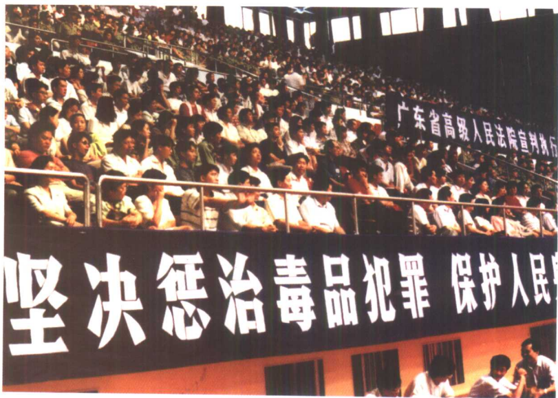
1996年8月15日，广东省高级人民法院召开宣判执行大会，对“9601”特大走私毒品案宣布终审裁定，7名毒犯被依法判处死刑。