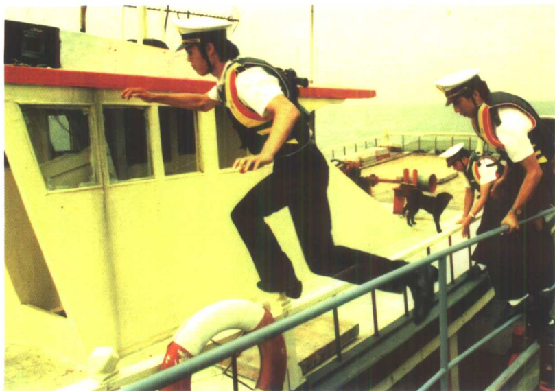
敏捷迅猛的海关缉毒队