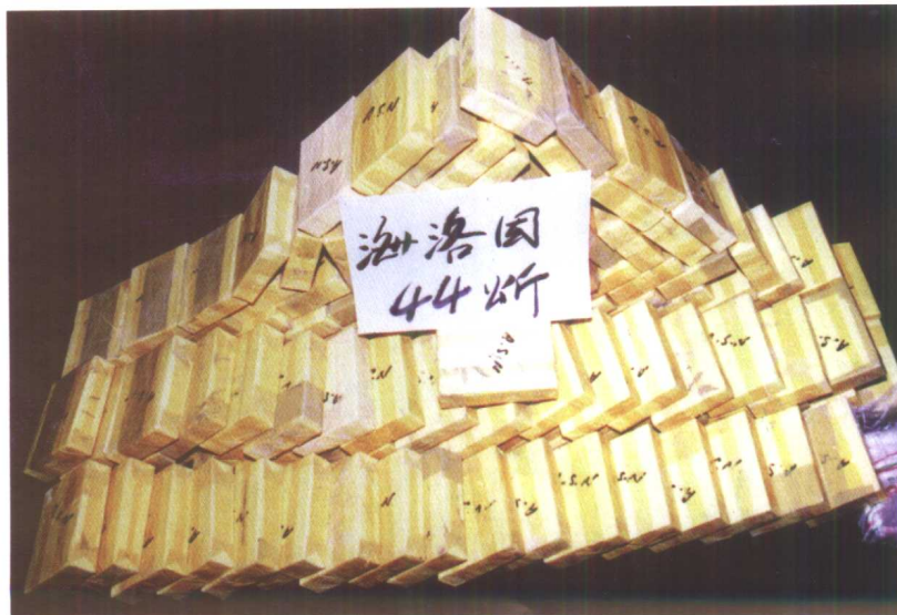
破案繳獲的大批海洛因