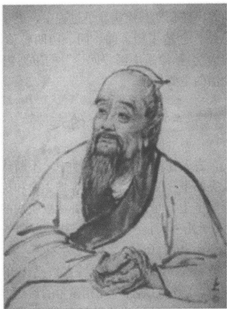
图 1-1-1 脉诊始祖——神医扁鹊

股以至于阴，当尚温也。”通过观形、察色、切脉的方法诊断太子是由气机逆乱而致的“厥”证，并以汤剂、针灸、药熨、按摩等疗法进行抢救，使虢太子起死回生。所以《史记》中说：“至今天下言脉者，由扁鹊也”。《淮南子·泰族训》中亦曰：“所以贵扁鹊者，非贵其随病而调药，贵其厌息脉血而知病所生也”。可见扁鹊是有文字记载最早的脉诊创始人，是运用切脉诊病的第一位代表人物。