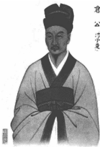
图 1-1-2 脉诊医案——神医仓公

脉，治验脉案均有笔录，后名为“诊籍”。由于他治学严谨，善于总结，在他收录的病案中，已出现 19 种脉象。亦称是脉学奠基人之一。