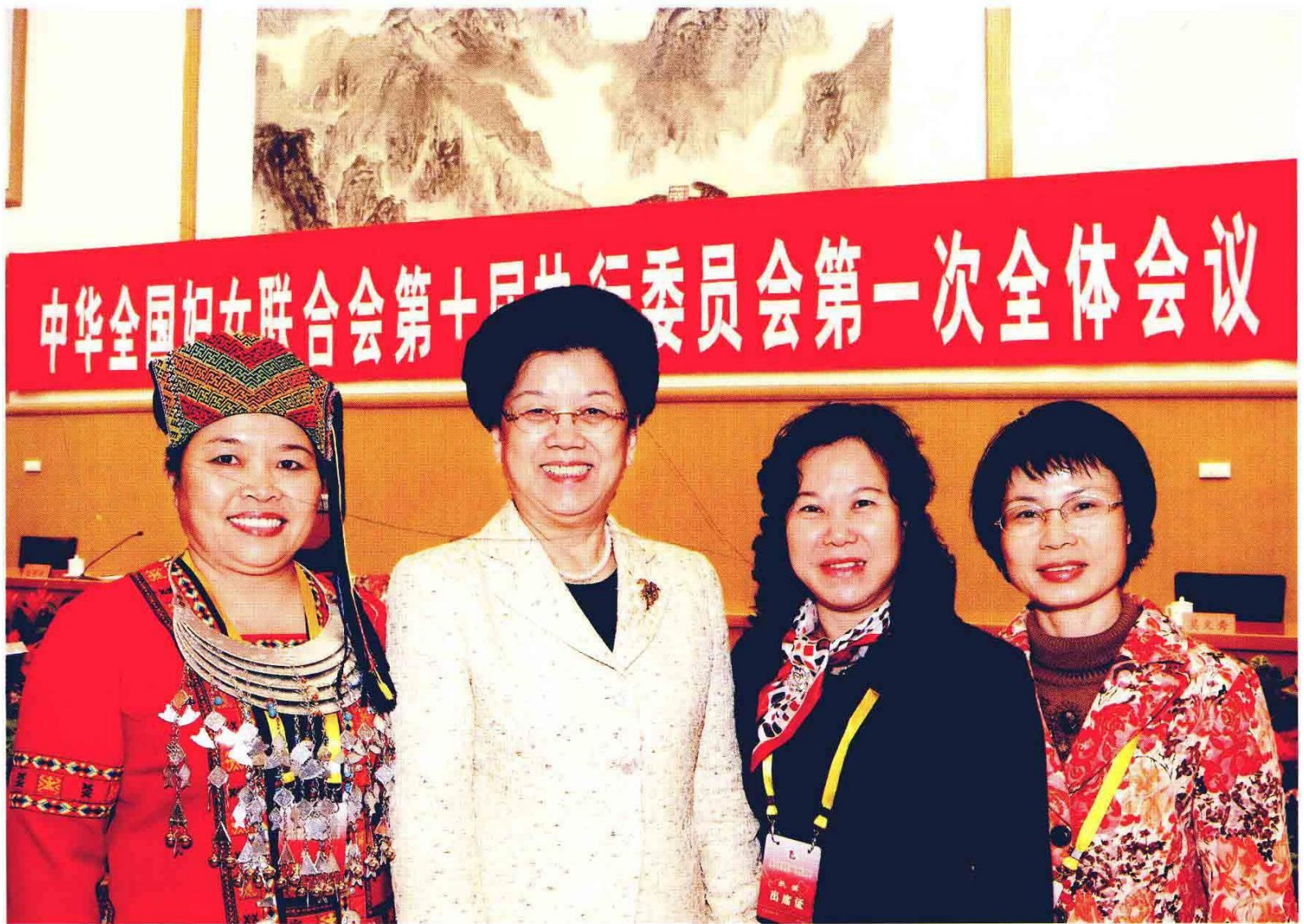
全国人大常委会副委员长、全国妇联主席陈至立（左二）与海南省中国妇女十大代表、全国妇联十届执委王琼珠（右二）、肖惠珠（右一）、刘海燕（左一）合影。