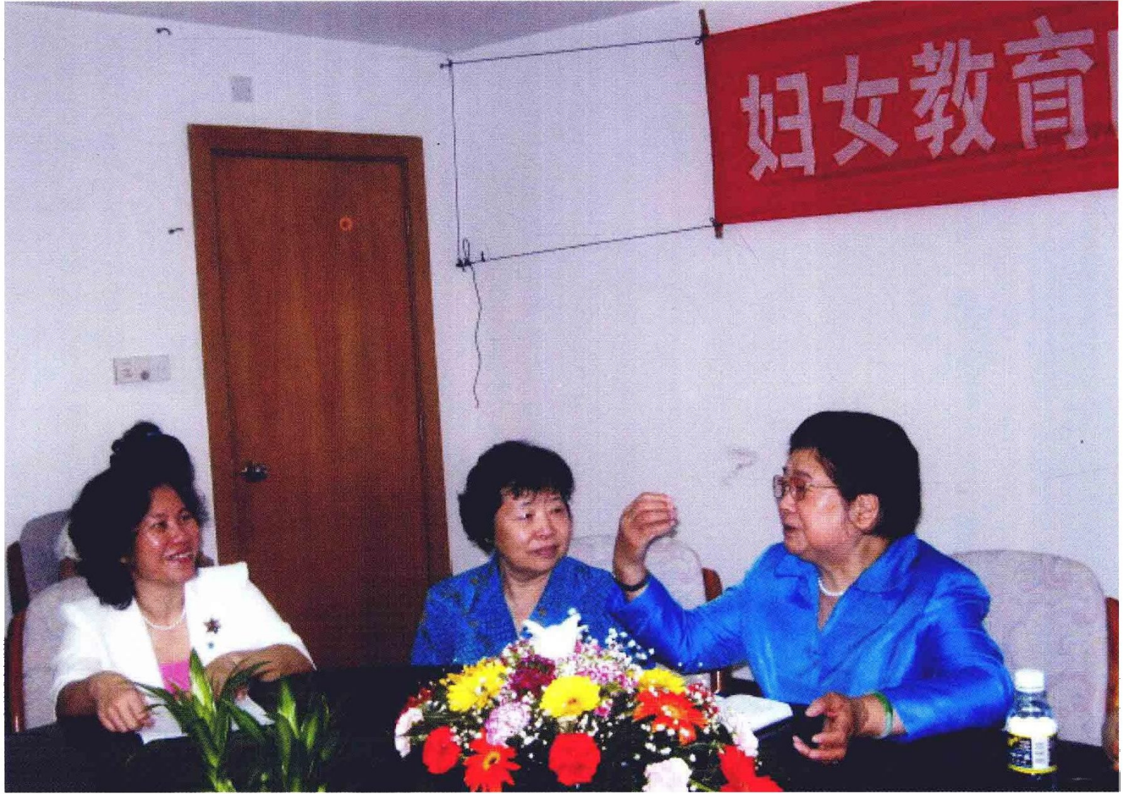
原全国人大副委员长、原全国妇联主席顾秀莲（右一）视察海南省妇联时，与原海南省人大常委会副主任王守初（右二）、省妇联主席王琼珠（右三）的影照。