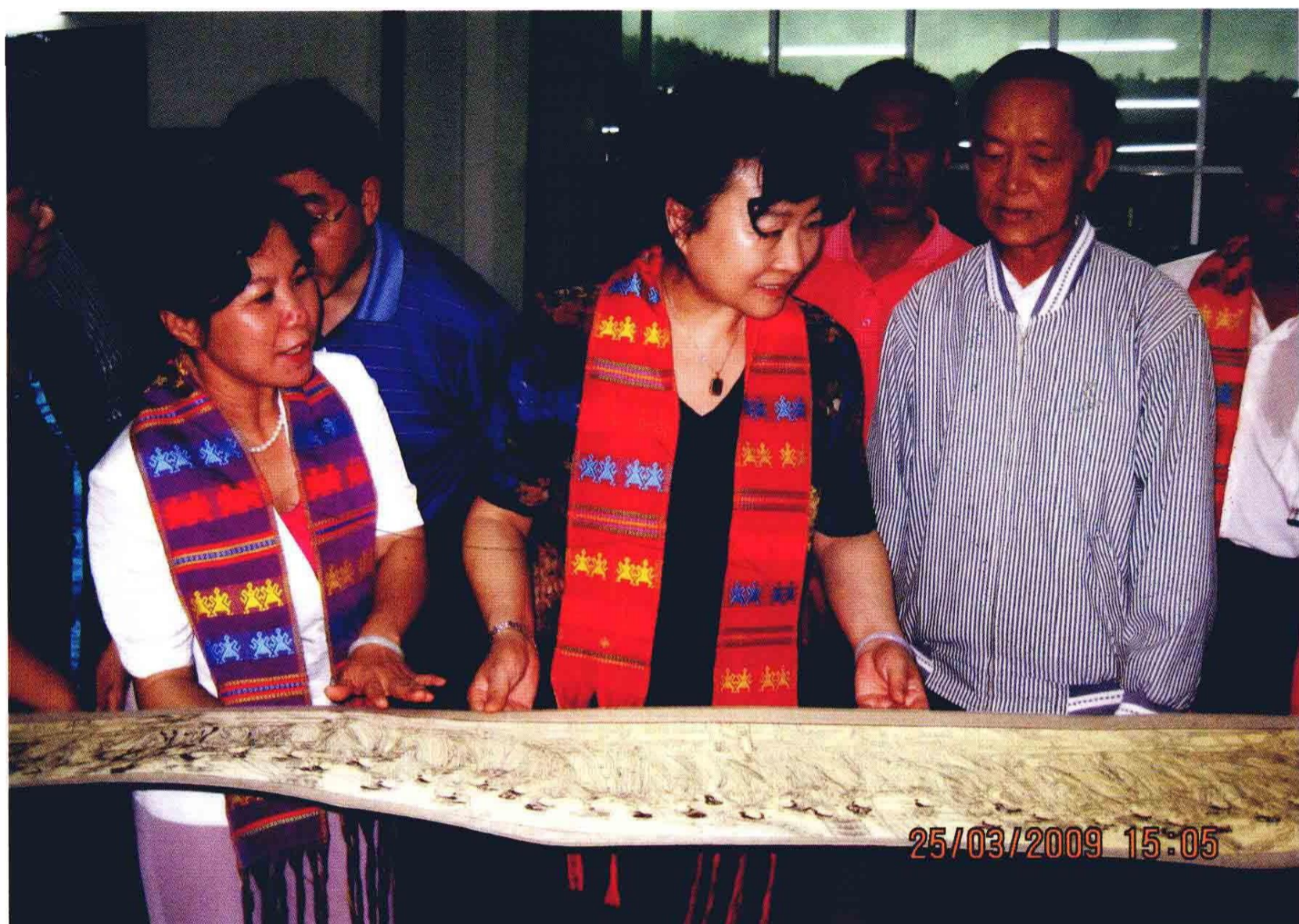
国家文化部副部长赵少华（中）考察五指山市黎锦苗绣基地