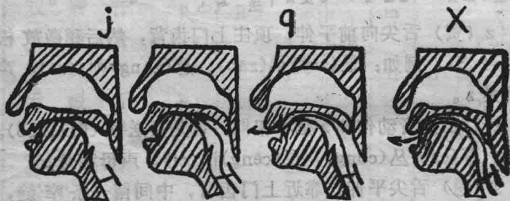
图1 准备 2 送气 3 发音 { 不送气 j 送气 q } 4

zh (知) 翘起舌尖, 抵住硬腭的前部, 然后稍微放松(图1、2、3)。例如: 政(zhèng)、治(zhì), 转(zhuǎn)折(zhé), 声母都是zh。