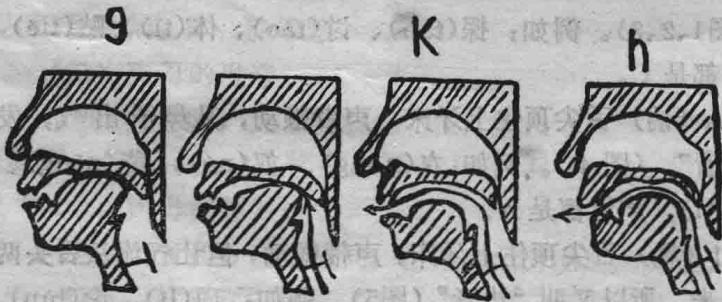
图1准备 2蓄气 3发音 { 不送气 g 送气 k } 4