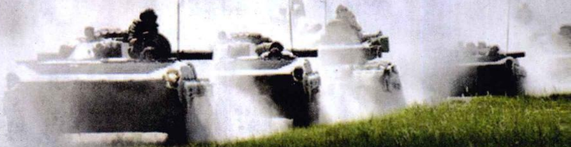
▼ 坦克编队参加演习