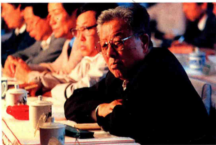
在辽阳市人大常委会任主任期间留影。