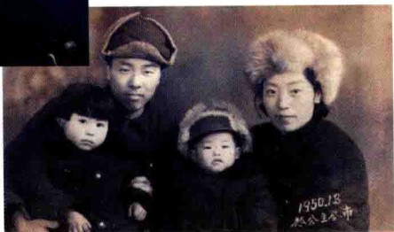
一九五〇年我和 女儿及外甥女同魏众 于公主岭。