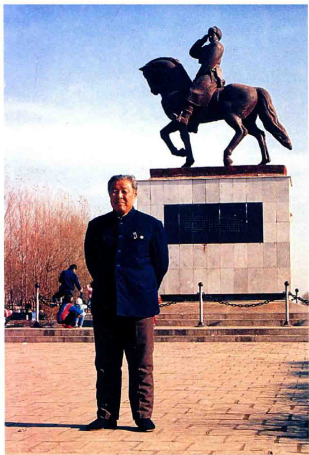
魏众于一九九〇年在辽阳市灯塔县李兆麟塑像前留影。